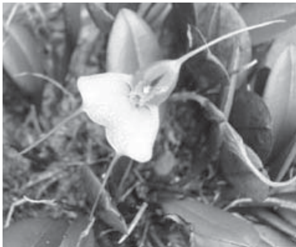
Foto 3. Masdevallia pteroglossa Schltr., especie exclusiva para Colombia y amenazada de extinción. Epífita encontrada en el relicto inferior de la Reserva, escasa.