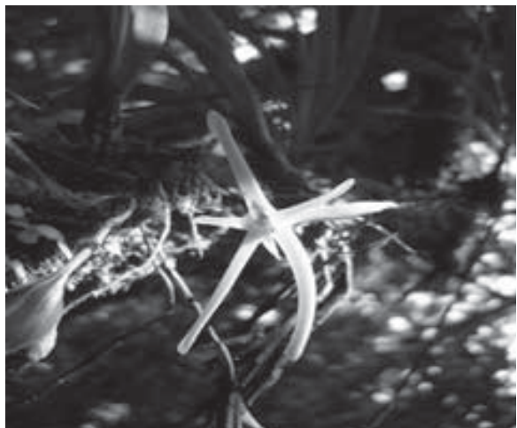
Foto 4. Cryptocentrum latifolium Schltr., especie epífita poco abundante y poco distribuida. Encontrada en el relicto inferior y superior de la Reserva.

El hábito de crecimiento predominante de las especies es epífita (88%) donde los géneros representativos del mismo fueron Epidendrum L. y Maxillaria Ruiz y Pav. Entre las terrestres (10%) sobresalió Sobralia Ruiz y Pav. y entre las rupícolas (4%), Cleistes Rich. ex Lindl. y Epistephium Kunth.