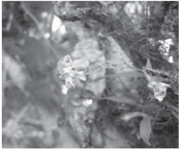
Foto 2. Oncidium adelaidae König, epífita común en los linderos y zonas de amortiguación de la Reserva.