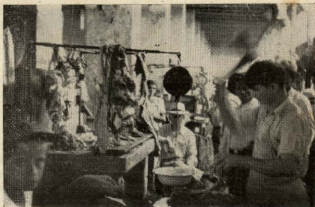
Fig. N o 12. — Otro aspecto de venta de carne.