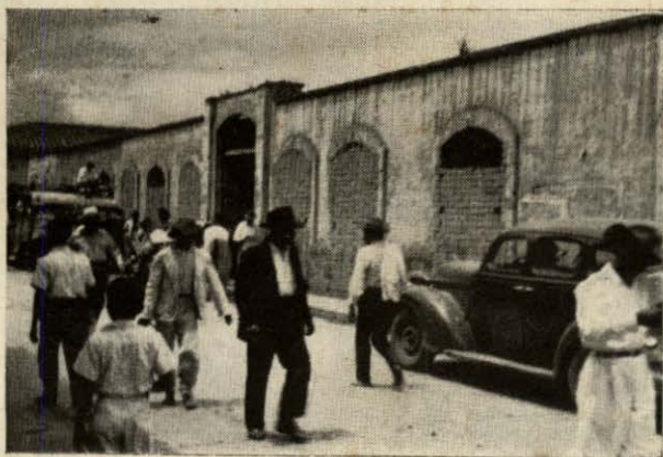
Fig. N° 3. — Costado Norte de la Plaza Antigua en el cual aparecen los daños causados por el incendio.