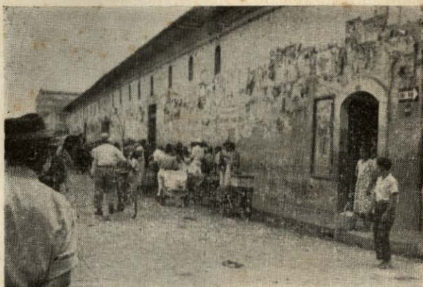
Fig. N° 2.—Aspecto exterior del costado Sur de la Plaza Antigua.