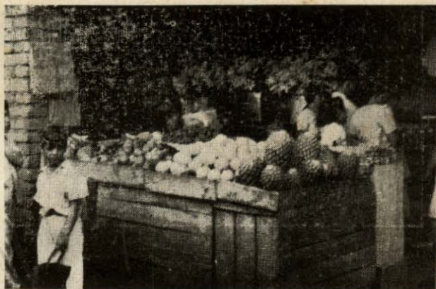
Fig. N° 8.—Otro aspecto de una venta de frutas.

Frutas. — En cajas de madera toscamente construídas se exponen las frutas a la vista del comprador, adquiriéndolas éste por inspección directa y deteriorándolas algunas veces durante el examen causando así una pérdida para el vendedor. Las ventas no se hacen con una medida uniforme sino que ésta varía con el artículo; las uvas son vendidas por libras, pero las naranjas, bananos, etc. se venden por unidades. El precio de venta se especifica por la cantidad, calidad y tamaño.