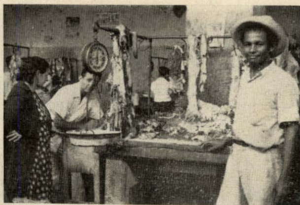
Fig. N o 11.—Puesto de venta de carne.

Carnes. — En el pabellón de carnes se encuentran 62 puestos, contruídos de cemento con una cubierta de baldosín, provistos de ganchos de hierro de los cuales se cuelga la carne. Estos bancos para la venta de carne de ganado mayor tienen las siguientes dimensiones: largo, 1.50 mts.; ancho, 0.85 mts.; alto 1.50 mts. Para la venta de carne de ganado menor dichos bancos tienen las siguientes dimensiones: 2.85 de largo, 0.85 de ancho y 1.50, de altura. Al lado de cada uno de éstos, los carniceros tienen un grueso tronco de madera sobre el cual cortan los huesos.