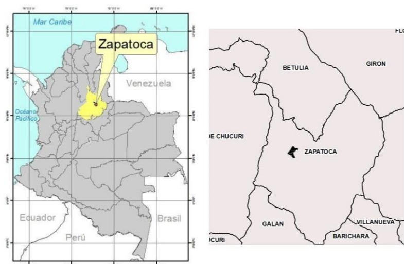
Figura 1. Ubicación geográfica de las RNSC MamáBertha y La Montaña Mágica – El Poleo como área de estudio, con respecto a la escala de país, departamento y municipio.