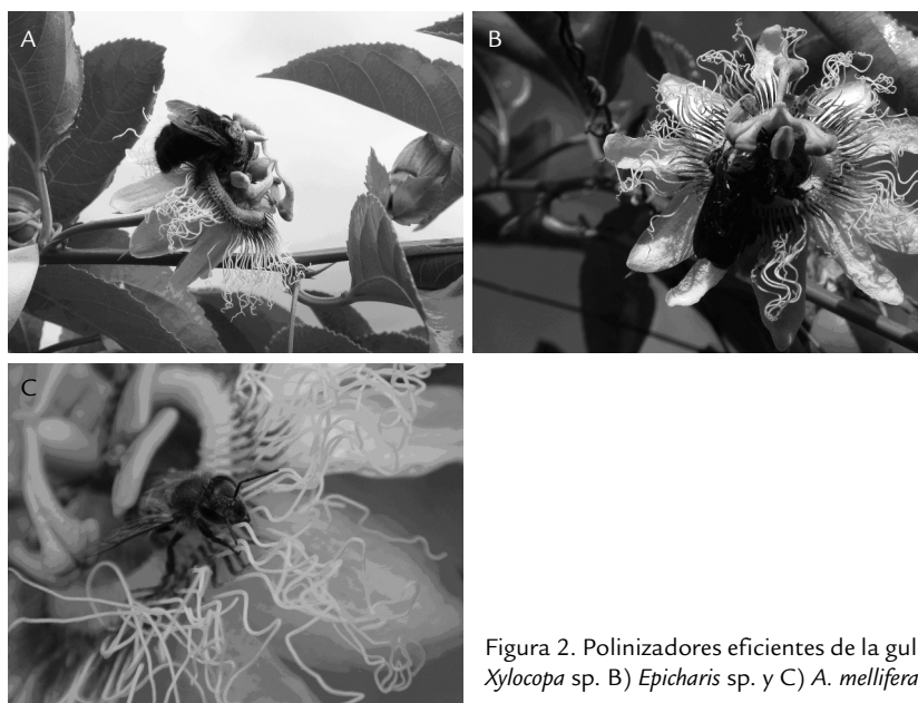
Figura 2. Polinizadores eficientes de la gulupa. A) Xylocopa sp. B) Epicharis sp. y C) A. mellifera .

386 Artículo - Efectos de la variación altitudinal sobre la polinización en cultivos de gulupa ( Passiflora edulis f. edulis ). Medina-Gutiérrez, et ál.