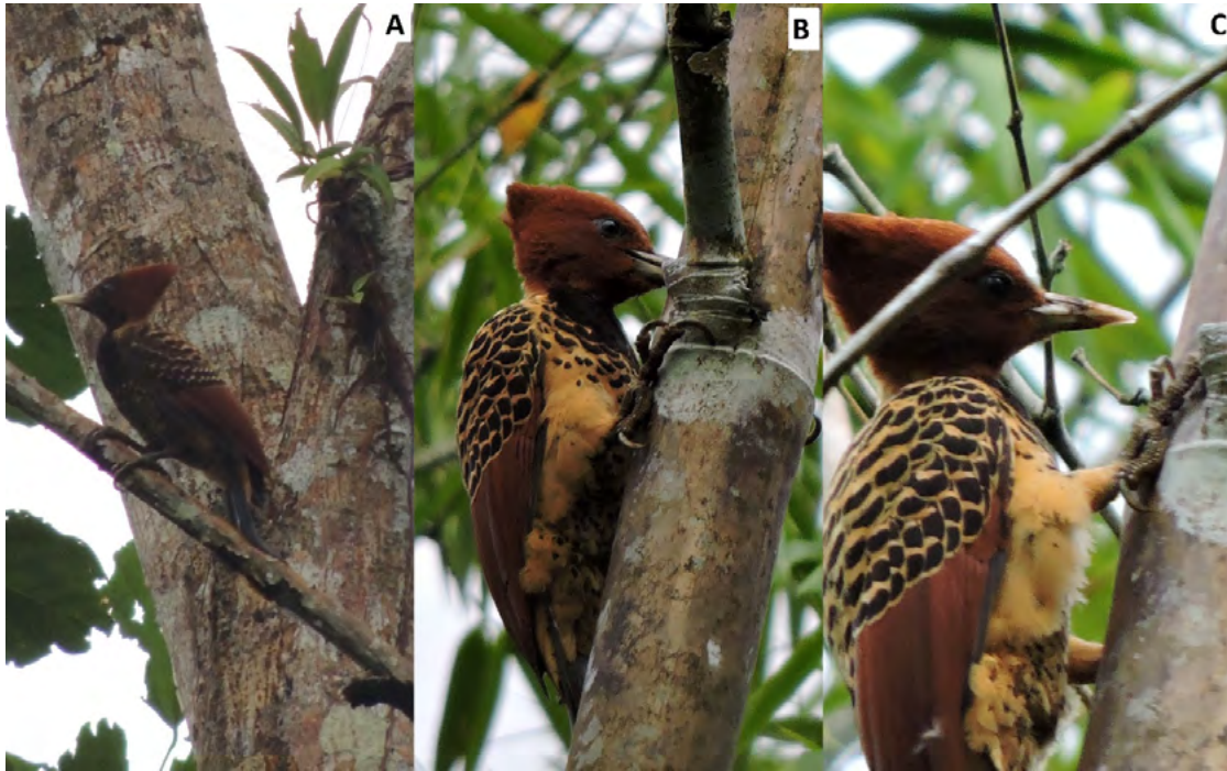
Figura 2. Serie de registros fotográficos de Celeus spectabilis en los alrededores del corregimiento de Mirafior, municipio de Piamonte, Cauca, Colombia. A. Individuo adulto fotografiado por GDB en julio de 2014. B-C. Individuo observado y fotografiado por ARB en 2015.

( Cecropia sp.) a una altura aproximada de 9 metros. El lugar del segundo registro fue en la vereda la Guajira, municipio Piamonte, departamento del Cauca ( 01^{\circ} 01' N , 076^{\circ} 27' W 300 m s.n.m.), además se evidenció que la especie habita en simpatria con C. flavus y C. elegans .