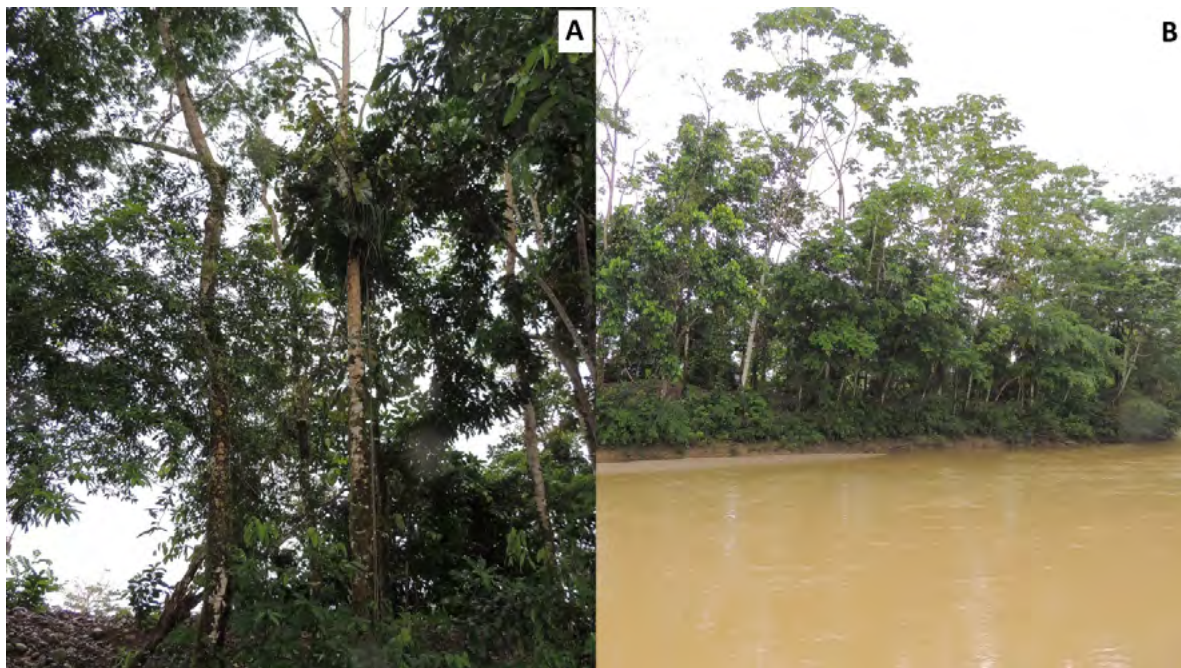
Figura 3. Fotografías de la localidad de registro de Celeus spectabilis (alrededores del corregimiento de Mirafior, municipio de Piamonte, Cauca, Colombia). A. Hábitat de Bosque húmedo tropical secundario. B. Bosque ribereño del río Guayuyaco, afluente del río Caquetá. Fotos GDB.

Estos registros extienden la distribución conocida de C. spectabilis ca. 175 km hacia el norte en la Amazonia Colombiana y representan al momento el punto más al norte de su distribución (Fig. 1). También, confirman la presencia de la especie en bosques húmedos de ribera