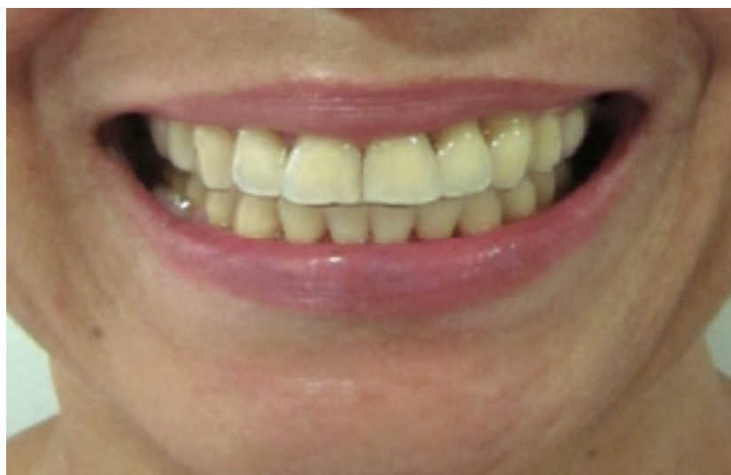
Figura 6. Fotografía extraoral sonrisa final: se observa placa easy 0.40 para contención en dientes superiores, se evidencia buena estética facial y dental. La paciente expresa seguridad a través de su sonrisa.

bucal; además, se realizó actualización de historia clínica, índice de Placa bacteriana, índice de Loe, índice de cálculo dental y examen oclusal. En cada uno de los controles se realizó mantenimiento periodontal que incluyó fase higiénica. Cada 6 meses se le ordenó radiografía panorámica para evidenciar estado de reabsorción ósea. En los controles no se evidencio ninguna de las complicaciones antes mencionadas, el índice de cálculo dental fue, en cada control, de 0; el índice de placa bacteriana no supero el 15% y la paciente se notaba motivada, con amplios conocimientos sobre higiene bucal y satisfecha con su nueva sonrisa (fig.6).