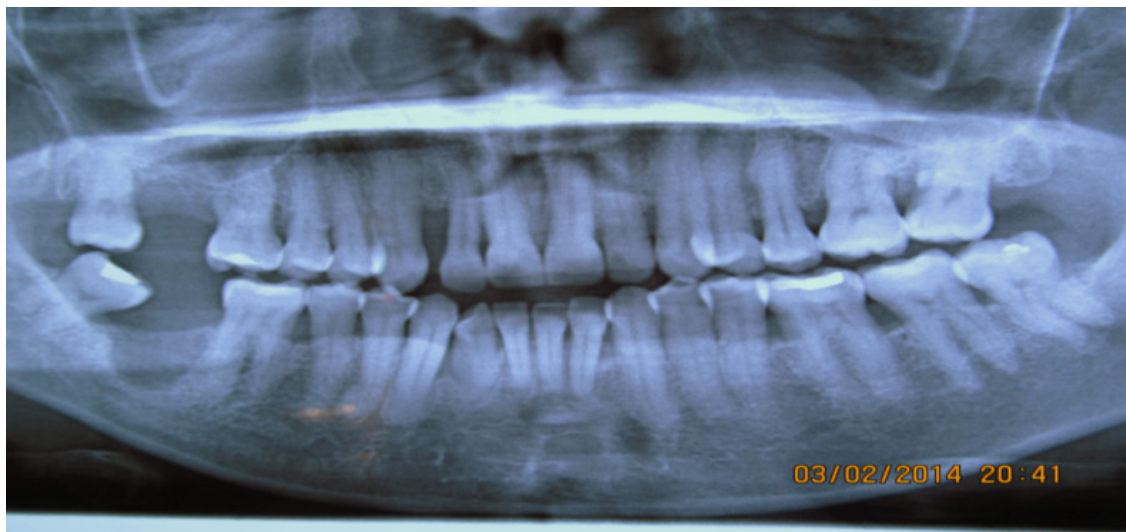
Figura 3. Radiografía panorámica: se evidencian pérdidas óseas, falta de paralelismo radicular y ausencia de los órganos dentarios 17 y 47.

Se realiza raspado y alisado radicular para controlar la inflamación y se hace un énfasis en educación en salud bucal. La paciente es motivada por medio de una charla donde conoció los beneficios que trae a su salud bucal y general los buenos hábitos de higiene bucal, se le enseñó cepillado con técnica de Bass e indicación de uso de ayudas como el enjuague bucal para combatir la placa bacteriana y la seda dental con la finalidad de inactivar la periodontitis crónica.