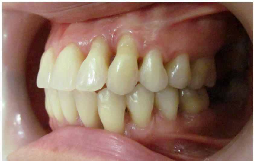
Figura 5. Fotografía intraoral lateral izquierda, luego de retirar la aparatología ortodóntica: se observan buena estética dental y notable mejoría en los tejidos de soporte.

El seguimiento que se le realizó a la paciente, luego de que se retiró la aparatología ortodóntica, fueron controles periodontales cada dos meses para evaluar posible recesión gingival, aparición de bolsas periodontales, inflamación gingival y el conocimiento del paciente sobre técnicas de higiene