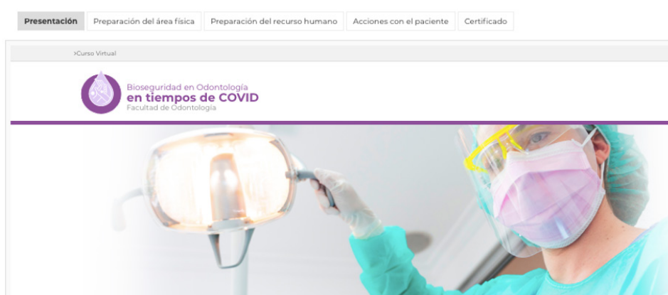
Figura 1. Entorno del curso virtual Bioseguridad en odontología en tiempos de la COVID-19