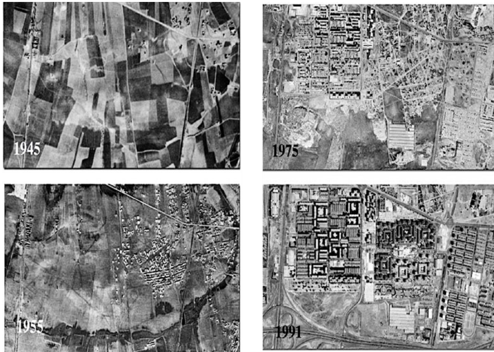
Figura 2. Transformación del distrito de Usera, Madrid.

Al igual que los distritos colindantes, Usera es un barrio obrero. En los años 80 se vio afectado por la delincuencia y la drogadicción (Arana, 2016). A partir del nuevo milenio, se convirtió en un barrio principalmente habitado por población de origen chino con más 11 000 ciudadanos chinos conviviendo. Actualmente, y debido a la gentrificación de la zona centro de Madrid, es un nuevo destino para alquilar vivienda (Rosal-Carmona, 2017). Los precios de los alquileres y de los pisos en venta se han incrementado, sobre todo después de que la empresa colaborativa Airbnb lo tildase de «barrio de moda» en Madrid (Salas, febrero 24, 2017).