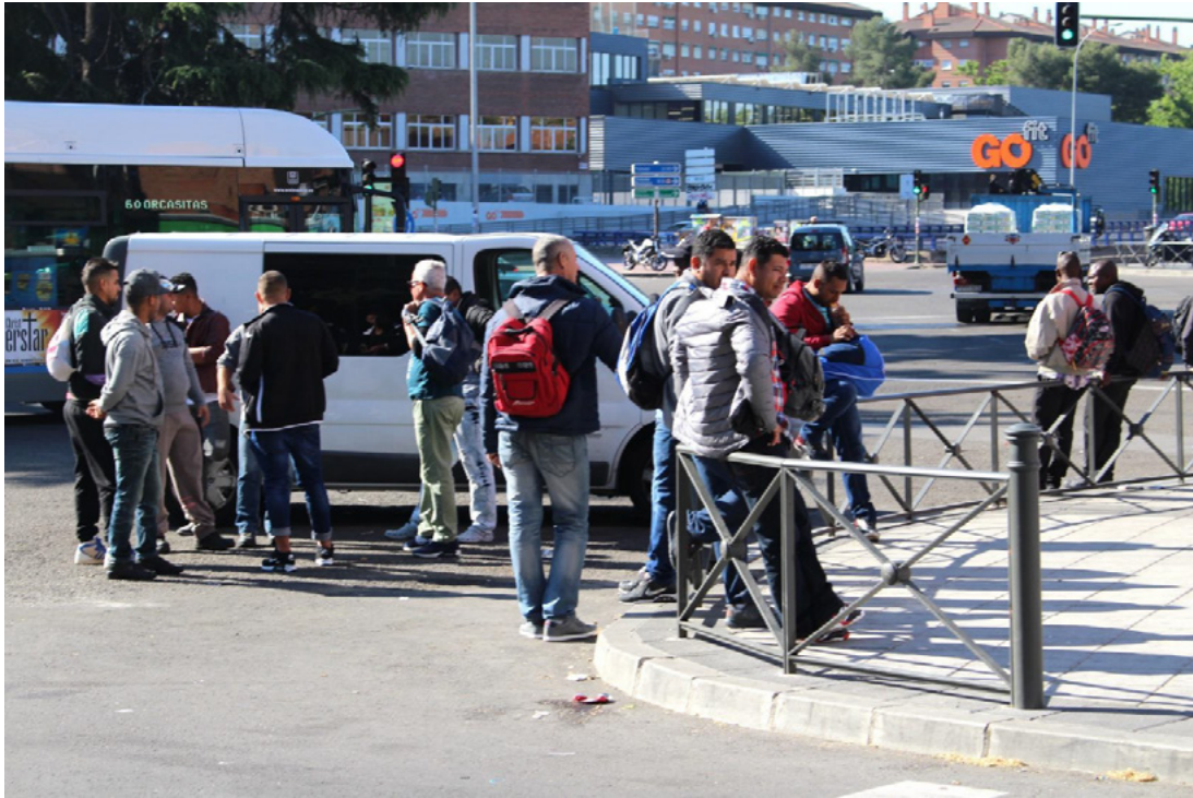
Figura 7. Población residente en Usera, de distintas nacionalidades, esperando para ir a trabajar, Madrid. Fuente: Fuentes-Lara, C. Rambaud, N. y Estupiñán, Ó. (2021). Población residente en Usera, de distintas nacionalidades, esperando para ir a trabajar.

La situación retratada se repite cada mañana en la plaza Elíptica, antigua plaza Fernández Ladreda, justo al límite entre el distrito de Usera y el de Carabanchel. Los hombres que esperan son jornaleros. El grupo de la izquierda discute las condiciones de trabajo con un contratista. Todos los días (domingos incluidos) vienen a esperar en la rotonda a que alguien venga a proponerles un día de trabajo. La precariedad laboral sigue siendo la misma descrita por Ferres en su novela.