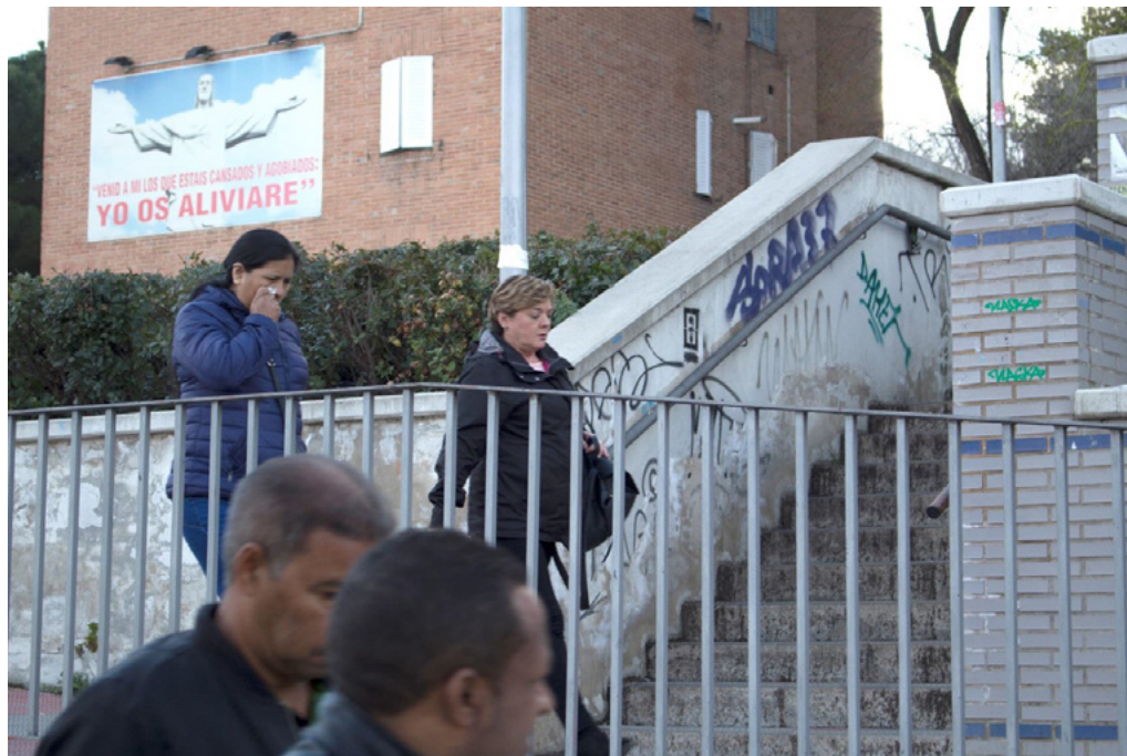
Figura 4. Población residente en Usera de distintas nacionalidades pasando por una iglesia, Madrid.

La imagen retrata una zona urbana que podría entrar dentro del tipo de fotografía documental. En el primer plano, vemos las cabezas desenfocadas de dos hombres. Detrás aparecen dos mujeres caminando por una rampa,