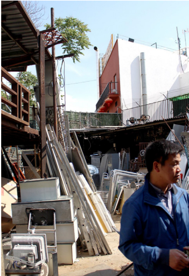
Figura 8. Transformación del barrio de Usera, Madrid.

personaje, en primer plano, queda desenfocado. El rojo de los farolillos y del edificio del mismo color atraen el ojo. El encuadre vertical, remarcado por las líneas verticales de las chimeneas, le da protagonismo al hombre que se dirige fuera de plano creando profundidad.