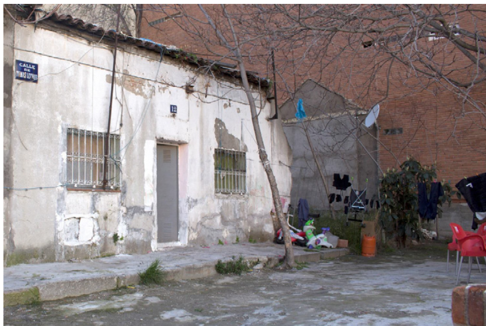
Figura 5. Chabola actual en el distrito de Usera, Madrid.

La composición de la imagen, en plano general, expone el deterioro de un espacio que comunica desde la textura misma de la fotografía; sus colores y las tonalidades de color nos permiten reflexionar que, si bien, la España de los años cincuenta, y en concreto el Madrid de esta década, estaba en continúa construcción urbanística, el Madrid de hoy está en una situación parecida. Todavía existen espacios a los que la urbanización contemporánea