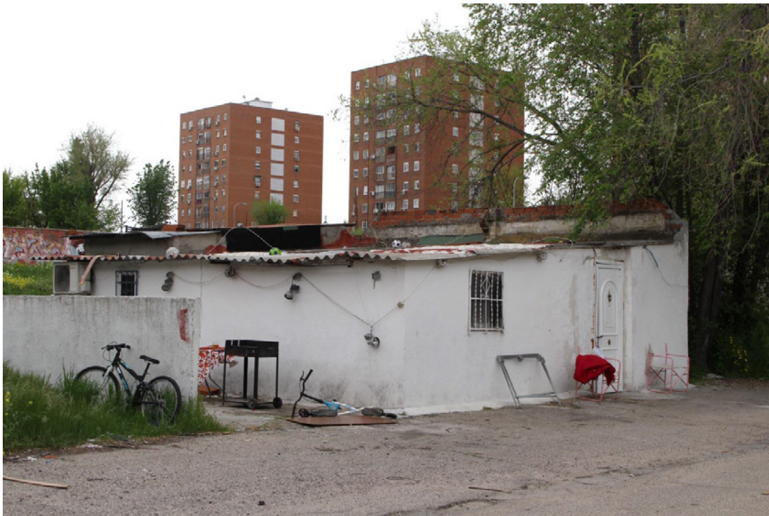
Figura 6. Contraste entre el chabolismo y los nuevos edificios en Usera, Madrid.

El tipo de la fotografía podría catalogarse dentro del género documental. En un primer plano, aparecen hombres de varias etnias esperando. Detrás hay una rotonda con tráfico, se reconoce el autobús 60 que lleva a Orcasitas. Al fondo, vemos un gimnasio de moda y varios edificios de ladrillos típicos de los barrios obreros de Madrid.