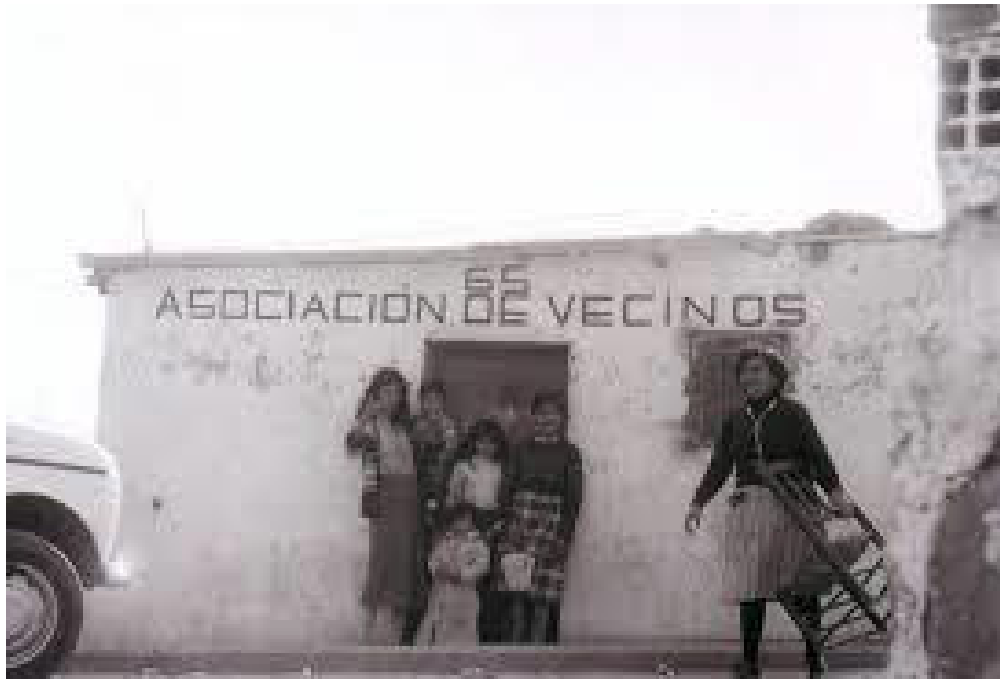
Figura 3. Fotografía de unos vecinos de Usera en la sede de la Asociación de Vecinos, Madrid.