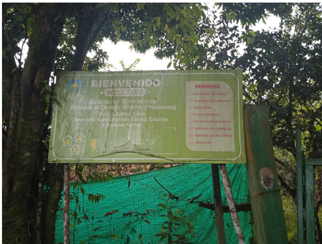
Figura 18. Entrada al sendero Prosiroma.

Es crucial armonizar esta situación y comprender que el arte rupestre sí es importante para las comunidades; asimismo, se debe reflexionar sobre cómo esta falta de interés representa una crisis social y cultural. Recientemente, desde la Institución Educativa Técnica Cualamaná, se ha intentado resignificar este valor para que la comunidad también se interese en promover