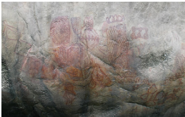
Figura 5. Pictografía encontrada en las Piedras del Tunjo en Facatativá (Chicuzaque, 2 de octubre de 2017).

En el Tolima, en cambio, la presencia del arte rupestre es dispersa y poco estudiada, lo que contrasta con otros lugares del país que cuentan con sitios arqueológicos de mayor magnitud y renombre. Adicionalmente, la falta de apoyo a los investigadores ha limitado el avance en la comprensión y conservación de este patrimonio.