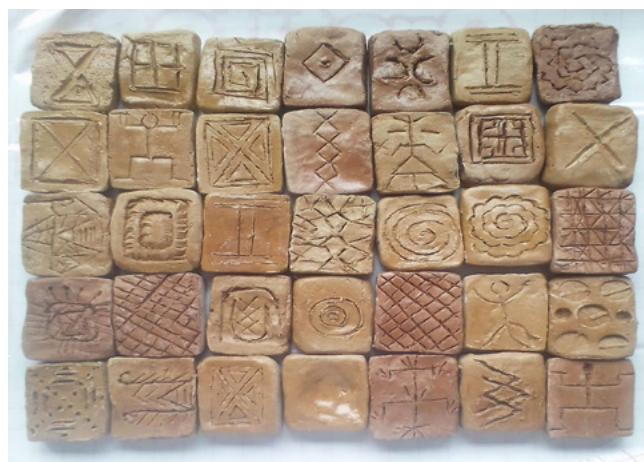
Figura 11. Colección elaborada por estudiantes del semillero COE COA.

Para la asignatura Taller de obra III, se buscó un material con el cual se lograra registrar huellas reales de los petroglifos y, para ello, se experimentó con caucho de silicona, yeso y resina epoxy, dado que estos materiales permiten extraer la imagen de la roca sin dañarla para, posteriormente, reproducirla múltiples veces. Al respecto, en este punto, es necesario agradecer a Gabriel Wualteros, de la Asociación Siroma, quien nos permitió el acceso a la roca.