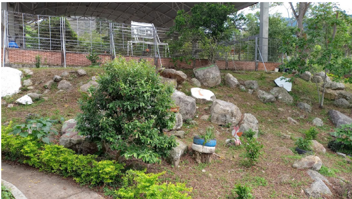
Figura 16. Paisaje de la Institución Educativa Técnica Cualamaná (zona rocosa).

Esta colección de rocas, paisaje que evoca milenios de evolución de la tierra, esconde vestigios de huellas del pasado y constituye un espacio vital para conectar con el paisaje natural y rupestre a través de prácticas estéticas y artísticas. En este sentido, el ejercicio consistió en un proceso instintivo y emotivo de sentir la tierra, donde el diálogo entre el espacio y los jóvenes permitió llevar a cabo acciones como depurar las rocas y pintarlas, generando con ello un sentido de conexión a través de la intervención en el lugar. No deja de causar alegría el simple hecho de que los estudiantes se emocionaran con tan solo limpiar una roca, en muchos casos, bajo el pretexto de escapar de las cuatro paredes del aula: «¡Profe, profe, sáquennos más seguido a limpiar las rocas!», pedían.