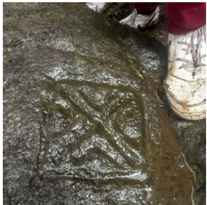
Figura 8. Petroglifos sector Prosiroma. Melgar, Tolima.

Al respecto, cabe anotar que la Asociación Prosiroma ha promovido una pequeña reserva natural y arqueológica en esta zona, ya que sus miembros han entendido el valor de preservar el entorno natural y el paisaje rupestre. Ahora, con el apoyo del presidente de la asociación, se busca crear una alianza que permita que los estudiantes se acerquen más a la comunidad y se puedan realizar acciones colectivas en torno a la conservación y cuidado de nuestro entorno. En este sentido, uno de los retos con respecto al arte rupestre local es lograr que los propietarios de los predios donde se encuentran comprendan la importancia de cuidar los petroglifos, y conservarlos para su expresión y valoración.