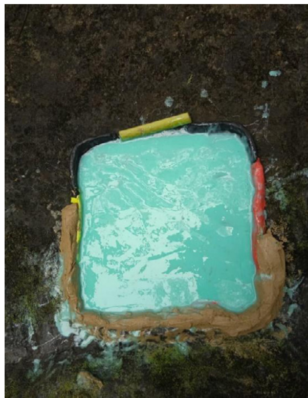
Figuras 14 y 15. Molde en caucho de silicona elaborado en uno de los recorridos con la colaboración de Gabriel Wualteros.