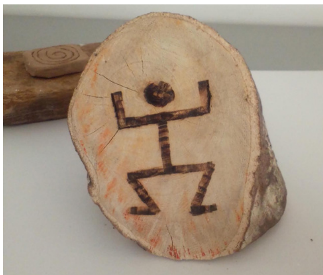
Figura 9. Ejercicio de pirograbado glifo.

Por otra parte, también se hizo un acercamiento al pirograbado sobre madera recolectada de la región, por medio de un ejercicio de aproximación gráfica a los glifos, partiendo de los propios imaginarios de los participantes, los cuales se fueron desarrollando a través de la experiencia estética de contemplación y apreciación. En paralelo, se llevaron a cabo actividades de experimentación con pirograbado con algunos estudiantes, las cuales, sin embargo, se vieron limitadas por la dificultad de contar con una mayor cantidad de herramientas.