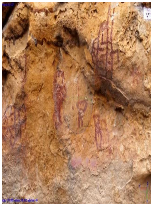
Figura 3. Pictografía de la cultura guane (Alvarado Ríos, 9 de enero de 2018).

En este territorio del departamento de Santander se han podido ubicar una serie de pinturas (tipografías) de la comunidad guane, las cuales están en peligro por diferentes factores. Específicamente, en la región de Mesa de los Santos (Santander), la antropóloga Mónica Johanna Giedelmann Reyes y su equipo han logrado establecer la georreferenciación de un total de 158 puntos de valor arqueológico, los cuales constituyen una colección de pinturas de enorme valor patrimonial y arqueológico que deben ser cuidadas y valoradas, como todos los sitios en nuestro país (Alvarado Ríos, 9 de enero de 2018).