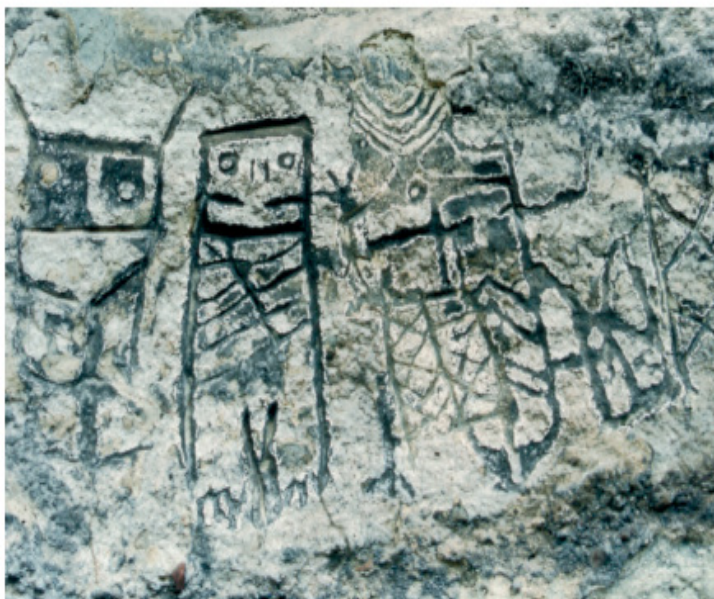
Figura 3.1.12. Grupo 3 (detalle). En este grupo el interior de los surcos aparece más oscuro que la superficie. No se ha determinado aún si esto se deba a la aplicación posterior de alguna sustancia, o a algún otro tipo de fenómeno producto del intemperismo.

De igual manera, se integró la investigación-creación de carácter exploratorio, ampliando así las fronteras del conocimiento y fomentando la innovación en el