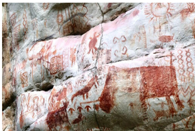
Figura 2. Cerro Azul. Serranía de la Lindosa (Sardiña, 8 de diciembre de 2020).

El auge del interés internacional por La Lindosa en los últimos años ha propiciado un debate más amplio sobre el arte rupestre en Colombia y su verdadera situación. Esta renovada atención no solo enfatiza la importancia de preservar estas manifestaciones culturales, sino que también resalta el papel vital que juegan las comunidades locales en la lucha por la conservación y el respeto por el legado ancestral (Muñoz, 2020). Lo que preocupa en este caso es por qué solamente a las comunidades locales les interesa su cuidado y conservación, y no a la sociedad mayoritaria. Al respecto, quizás sea porque estas comunidades otorgan un mayor valor a sus raíces culturales que los mestizos, algo que hay que cambiar y que es posible a través de procesos educativos para divulgar y valorar el arte rupestre presente en las comunidades no solo indígenas, sino también en la comunidad en general.