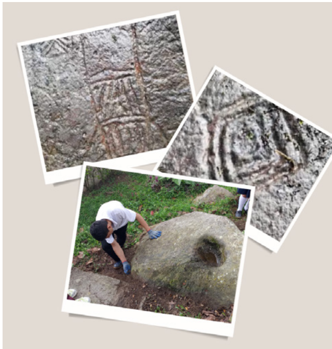
Figura 7. Petroglifos Cualamaná Melgar, Tolima.

A través de estas experiencias, se ha buscado promover una mejor comprensión y valoración del arte rupestre, así como fomentar la conciencia ambiental y el cuidado del entorno. Es así como el presente texto documenta los hallazgos, acciones, reflexiones, resultados y desafíos encontrados durante el desarrollo de la experiencia, destacando la importancia del arte, la naturaleza y la comunidad en la formación integral de los estudiantes.