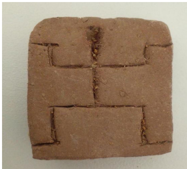
Figura 10. Experimentación con arcilla por parte de estudiantes de grado décimo (2022).