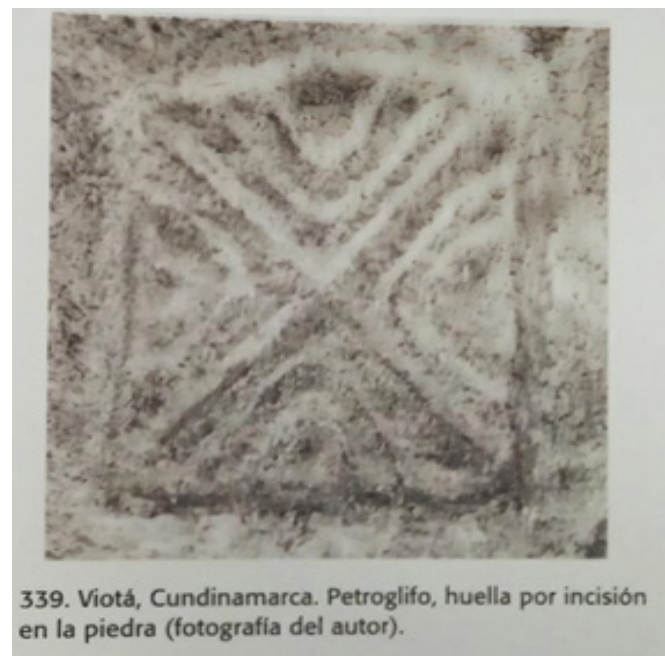
Figura 4. Petroglifo. Viotá Cundinamarca (Contreras Díaz, 2018, p. 120).