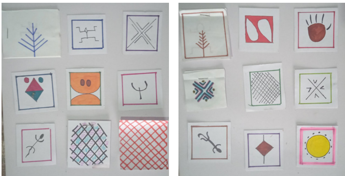
Figuras 12 y 13. Dibujos de glifos.