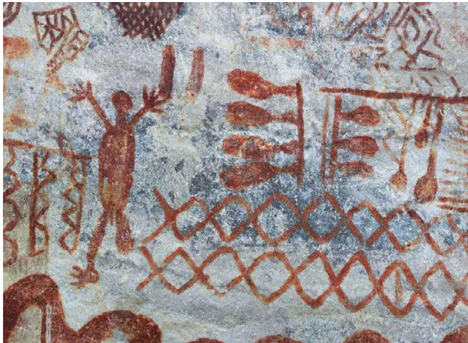
Figura 1. Pictografía Chiribiquete, Caserío Nuevo Tolima.

A continuación, se presentan algunos sitios de arte rupestre en la zona que son de especial importancia por su popularidad y también por su valor patrimonial.