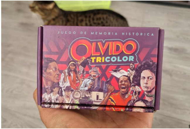
Figura 5. Fotografía del Juego de mesa Olvido Tricolor.