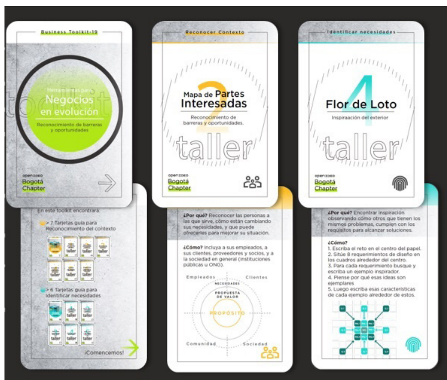
Figura 3. Fotografía Proyecto Kit de diseño estratégico para negocios en evolución.