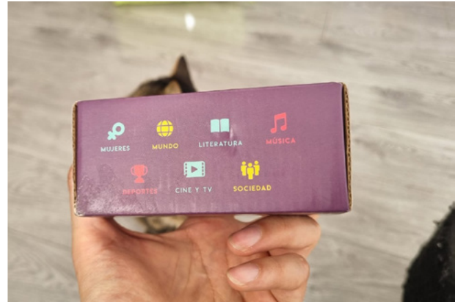
Figura 6. Fotografía del Juego de mesa Olvido Tricolor.

en el desarrollo de habilidades nuevas y actuales, puede potenciar el rol estratégico de diseñar donde antes no se había diseñado.