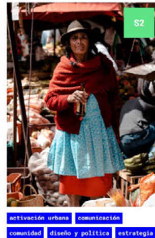
Figura 7. Captura de pantalla de la clase Diseño y Territorio Uniandes.

Esta curso introduce una base teórica y conceptual dividida a fundamentar al en el desarrollo del