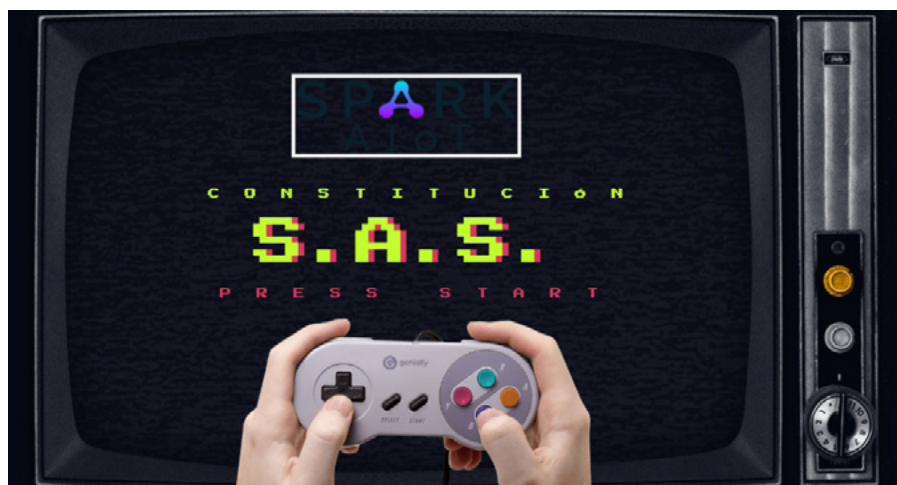
Figura 2. Fotografía Proyecto Guía de Constitución de Sociedades.