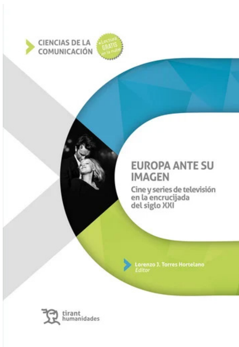
Figura 1. Portada del libro Europa ante su imagen: cine y series de televisión en la encrucijada del siglo XXI .

su influjo en la construcción ideológica de las naciones y la afectación en los personajes. Esta sección del libro es una mirada a las cicatrices de un pasado marcado por los horrores de las guerras y la agonía del mundo rural en el marco de la modernidad, donde la perspectiva del presente y la ficción propician una reflexión profunda en torno a la identidad y la alteridad.