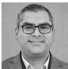
MANUEL ALEJANDRO RIVERA CAREAGA

Recibido: 4/09/2024; Aceptado: 14/05/2025; Publicado en línea: 30/06/2025 https://doi.org/10.15446/actio.v9n1.121528