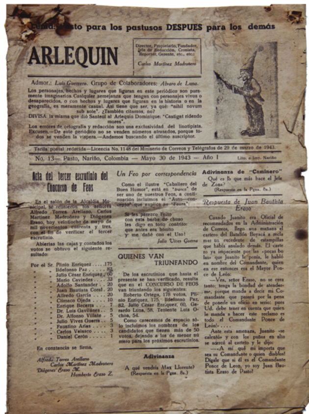
Figura 9. Primera página periódico Arlequín . 30 de mayo de 1943

Los personajes, hechos y lugares que figuran en este periódico son puramente imaginarios. Cualquier semejanza que tengan con personajes vivos o desaparecidos, o con hechos y lugares que figuran en la historia o en la geografía, es meramente casual. Así tiene que ser, ya que: inhiil novum sub sole . ¿También citamos, no? (Martínez, 1943, p. 1A)