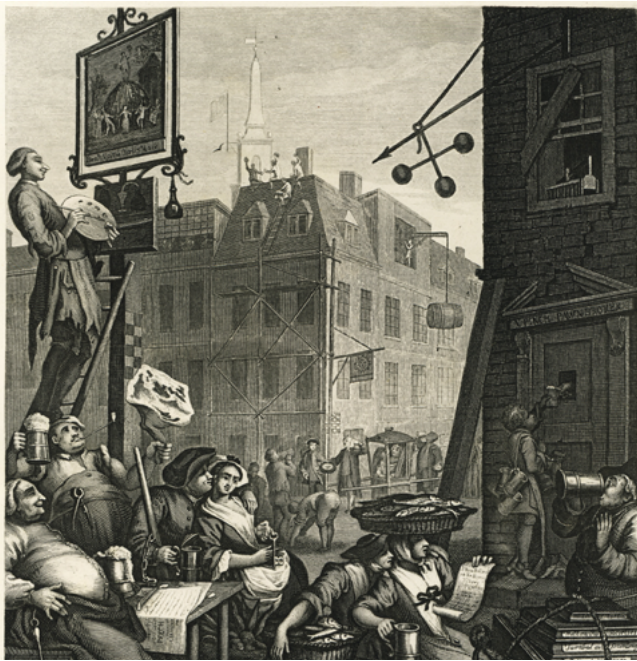
Figura 1. Beer street 1740's, de William Hogarth.

Es una condición del orden, y la libertad no es posible dentro del orden. De ahí que el poder sea el fenómeno social por excelencia, puesto que, de una parte, él no se concibe fuera de la sociedad, y de otra parte, sin un poder actuante, una sociedad es un cuerpo inerte, próximo a su decadencia. (p. 92)