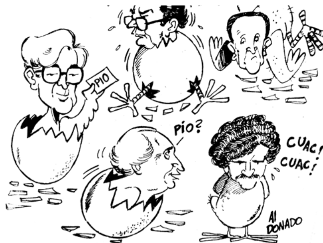
Figura 3 Grr... P..iio. de Al Donado. Tomada de El Derecho . 7 septiembre. de 1984

establecieron posiciones y criterios en oposición a las realidades, sociales, políticas y económicas, entre otros aspectos.