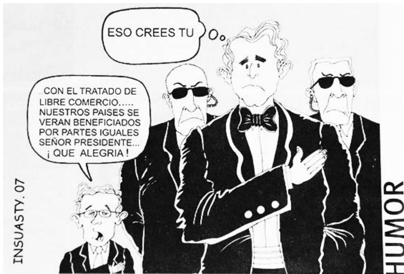
Figura 11. Eso crees tú , de Insuasty . Tomado de periódico Nariño Territorio de Encuentros (2007). Editorial. Pág. 4A. 7-14 de abril de 2007.

exploración formal de las expresiones más recurrentes de un personaje. En este sentido, «Tenemos que distinguir entre lo que Töpffer llama los rasgos permanentes , que indican el carácter, y los no permanentes , que indican la emoción» (Gömbrich, 1979 p. 294). Es decir que el accionar del caricaturista se ejecuta por medio del análisis sobre la personalidad y los elementos gestuales de un personaje a través de observar aspectos expresivos que aluden a la percepción fisionómica. Por su parte, la elaboración de la caricatura obedece a un proceso.