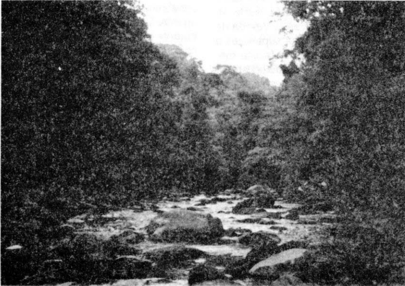
Figura 4. Quebrada los Martires (en el límite de los departamentos de Boyacá y Santander), municipio de Otanche, corregimiento La Betania, vereda de Cocos; habitat de M. cypris , M. amathonte y M. peleides .

La especie con distribución más amplia es M. peleides , debido a que no sólo habita en bosque primario, sino que, también se adapta a zonas perturbadas (bosque secundario) y es más tolerante a la presencia del hombre, pues es frecuente encontrarla en los trapiches y alrededores de las casas (Veredas Camilo y La Curubita). Esta especie suele volar bajo, por entre los senderos del bosque, facilitando su captura mediante jamas y trampas Van Sommeren-Rydon, utilizando cebos de banano, piña y guarapo. Vuela durante todo el año, observándose poblaciones relativamente grandes. Los adultos pudieron observarse libando néctar o consumiendo frutos en descomposición de plantas de: Cacao de monte Pachira aquatica Aubl (Bombacaceae); Guayabo de monte Bellucia axinanthera Triana (Melastomataceae);