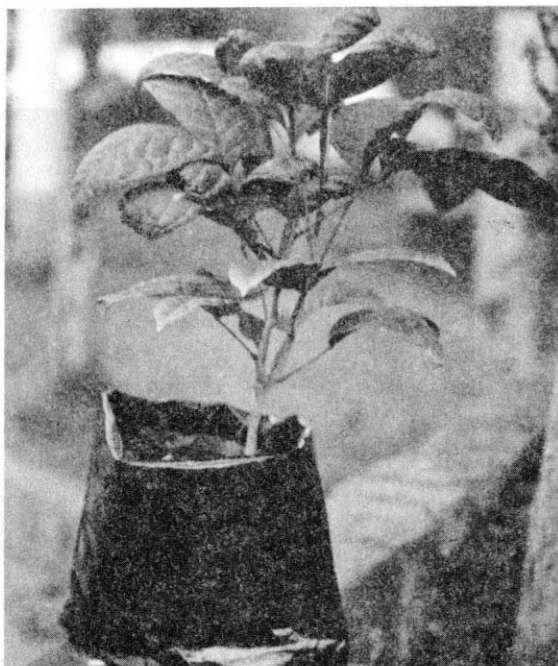
Figura 3. Inga marginata Willd: planta hospedera de las orugas de Morpho cypris De Vries.

Las orugas aumentan su longitud desde 3 mm hasta 7 mm y se caracterizan por presentar la cápsula cefálica cubierta de una felpa tupida de color rojizo, el cuerpo es de color amarillo pálido y presenta tres manchas de color café rojizo, situados a lo largo del dorso (Figura 2).