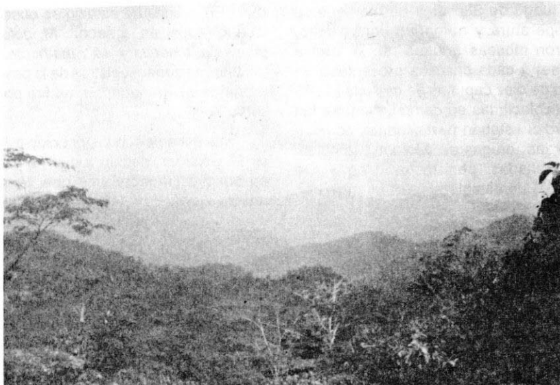
Figura 5. Vista parcial de la Serranía de «Las Quinchas» en Otanche, corregimiento de Betania; se puede observar la topografía quebrada y el estado de conservación de la vegetación.

Caracolí Anacardium excelsum (B. et B.). Sks (Anacardiaceae) y Machaerium sp. (Papilionaceae).