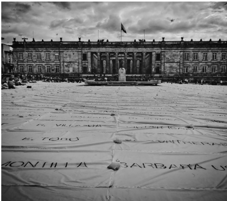
Imagen 2. Screenshot tomado de Instagram.

...nos acercamos a quien parecía ser quien lideraba la logística, nos presentamos y le mostramos nuestro listado y le pedimos material para empezar a trabajar. Para nuestra sorpresa, la respuesta de la señora fue: “no pueden escribir esos nombres, solo los que están en los listados”. A lo que replicamos: “no son solo nombres, son nuestros padres y madres”. Y ella insistió: “No. No se puede. solo los 1.025 nombres que hay en los listados que nos pasó la unidad de víctimas. De los 8.000 escogimos aleatoriamente los 1.025. y son los que caben en las telas cortadas que tienen la medida exacta para cubrir la plaza” (...) Finalmente, no nos dieron material y ni para hacer nuestros nombres ni los de los listados (...) Señora Doris Salcedo, su iniciativa fue preciosa, su obra perfecta sin embargo le faltó alma. Le faltó dolientes para que tuviera el sentido que usted pretende en sus obras que es hacer un duelo. Para quienes hemos puesto muertos a esta guerra, ellos y ellas no son un número más, no son un nombre aleatorio, son para nosotros una historia que queremos contar 27 .