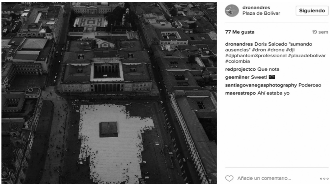
Imagen 5. Screenshot tomado de Instagram. Usuario: dronandres

me escurrieron varias lágrimas: era como un recuerdo de niñez, escuchar cómo caía la tierra y golpeaba el ataúd. Era eso: era escuchar el golpe de la tela contra el piso. Era escuchar eso: ¡Estoy de verdad echándole tierra a alguien! Estaba compartiendo con una de las tejedoras del Costurero de la Memoria de Medellín y me dijo: “Cuando no estén ahí nos van a hacer falta, los vamos a extrañar”. Es decir, cuando esta tela no esté aquí nos van a hacer falta. Y sí, tu estableces un vínculo, yo buscaba en la plaza los nombres que yo había escrito en el museo: “Mira, ese lo escribí yo”. Uno establece un vínculo que es inesperado. Incluso a veces voy a la Plaza de Bolívar porque significó mucho la experiencia para mí, me sentí como parte de un todo (...) A veces voy a la Plaza de Bolívar imaginándome el manto blanco que vi. No esperando que esté ahí, pero sí recordando que ahí hubo un manto blanco (Imagen 5).