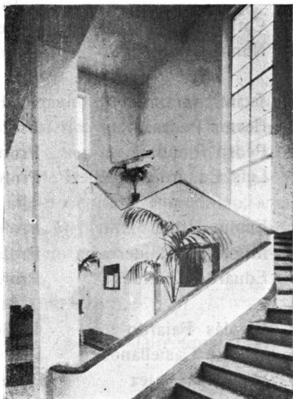
INSTITUTO DE EDUCACION FÍSICA El Hall.

Ocupa actualmente el edificio construido en la Ciudad Universitaria, donde el Instituto tiene bastantes comodidades, especialmente la relativa a los campos de deportes, que lo coloca en una situación verdaderamente privilegiada. Inmediato al estadio, con capacidad para 20.000 espectadores, con todos los requisitos que la técnica exige, con su bella presentación, condiciones que lo colocan entre los mejores de su género. Cuenta también el Instituto con una magnífica cancha de basket-ball, y pronto tendrá la de tenis, el campo de entrenamiento, etc. El Instituto está ya admirablemente dotado y no tendrá nada que envidiar a sus similares extranjeros cuando estén terminados el gimnasio, la piscina, el salón para esgrima para gimnasia rítmica, etc. Es indispensable la construcción de estas dependencias, que benefician igualmente a toda la Universidad y que contribuirán definitivamente a implantar y fomentar las actividades de la Educación Física en la Universidad Nacional. No cabe duda que esta es una de las necesidades más urgentes dentro del proyecto general de la Ciudad Universitaria, si se quiere colocar a la educación física en el plano en que figura en todas las Universidades del mundo.