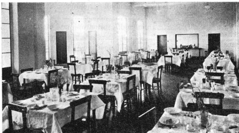
INSTITUTO DE EDUCACION FÍSICA. Comedor.