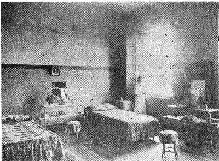
ESCUELA DE ENFERMERAS. Dormitorio de alumnas.

En consecuencia, este contrato podrá ser modificado por convenios posteriores, celebrados entre la Universidad y la So-