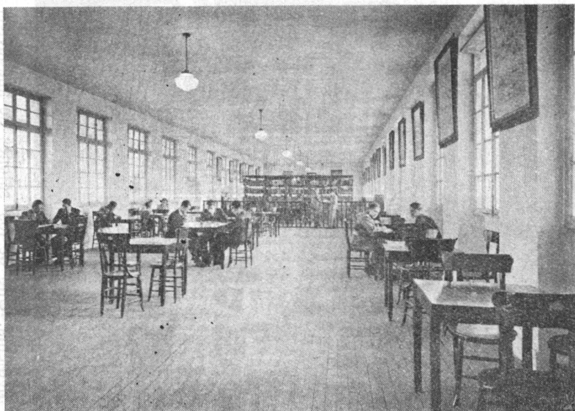
Biblioteca y salón de lectura de la Facultad de Matemáticas e Ingeniería.

Comenzó la organización por la Biblioteca de la Facultad de Derecho a fines de 1937. Actualmente están en vía de organización las de la Facultad de Ingeniería, Escuela de Bellas Artes, Escuela de Medicina Veterinaria y Conservatorio Nacional de Música.