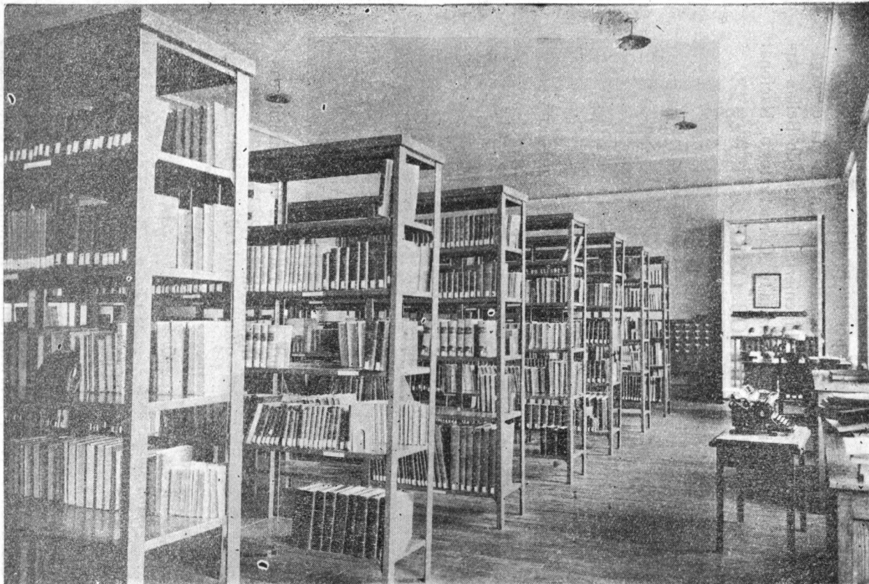
Biblioteca de la Facultad de Medicina. Uno de los salones de anaqueles; al fondo, a la derecha, el salón de lectura.