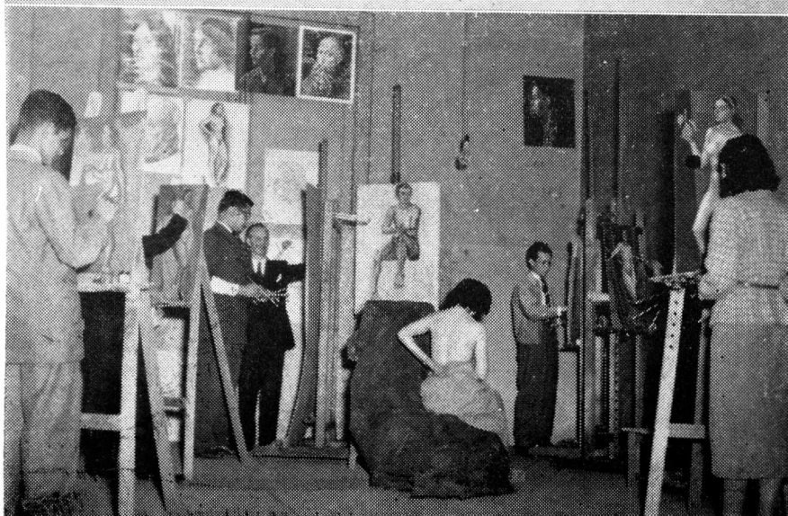
Clase de Pintura