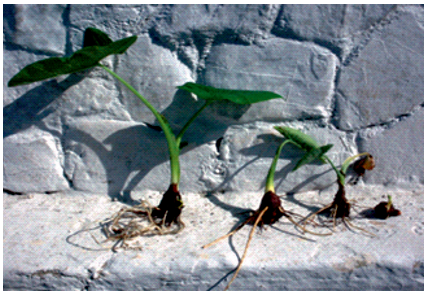
Figura 1. Síntomas en las plantas producidas in vitro inoculadas con los patógenos y el control. a) control, b) plantas inoculadas con F. oxysporum , c) plantas inoculadas con S. rolfsii d) plantas inoculadas con la mezcla de los tres hongos.

raíces enfermas, las mismas presentaron diferencias significativas con las plantas empleadas como control. Las plantas inoculadas con cada uno de los hongos por separado no presentaron diferencias significativas entre ellas en las variables evaluadas, pero sí en relación con las plantas inoculadas con la mezcla de los hongos, donde se obtuvo el mayor efecto depresivo (tabla 1). Estos resultados están en correspondencia con los obtenidos por Perneel et al. (2006) en la República Dominicana, donde determinó que Fusarium sp. y Rhizoctonia solani son los principales organismos