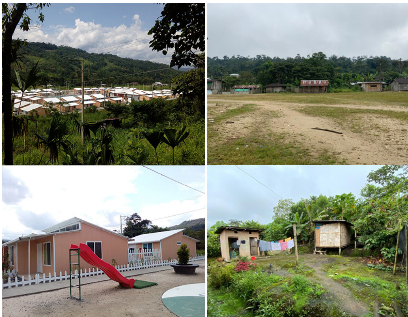
Figura 2. Producción estatal de vivienda en la Amazonía, “Urbanización Hermana Guillermina Gavilanes” (izquierda) en contraste con las viviendas comunitarias, ambas en periferias urbanas