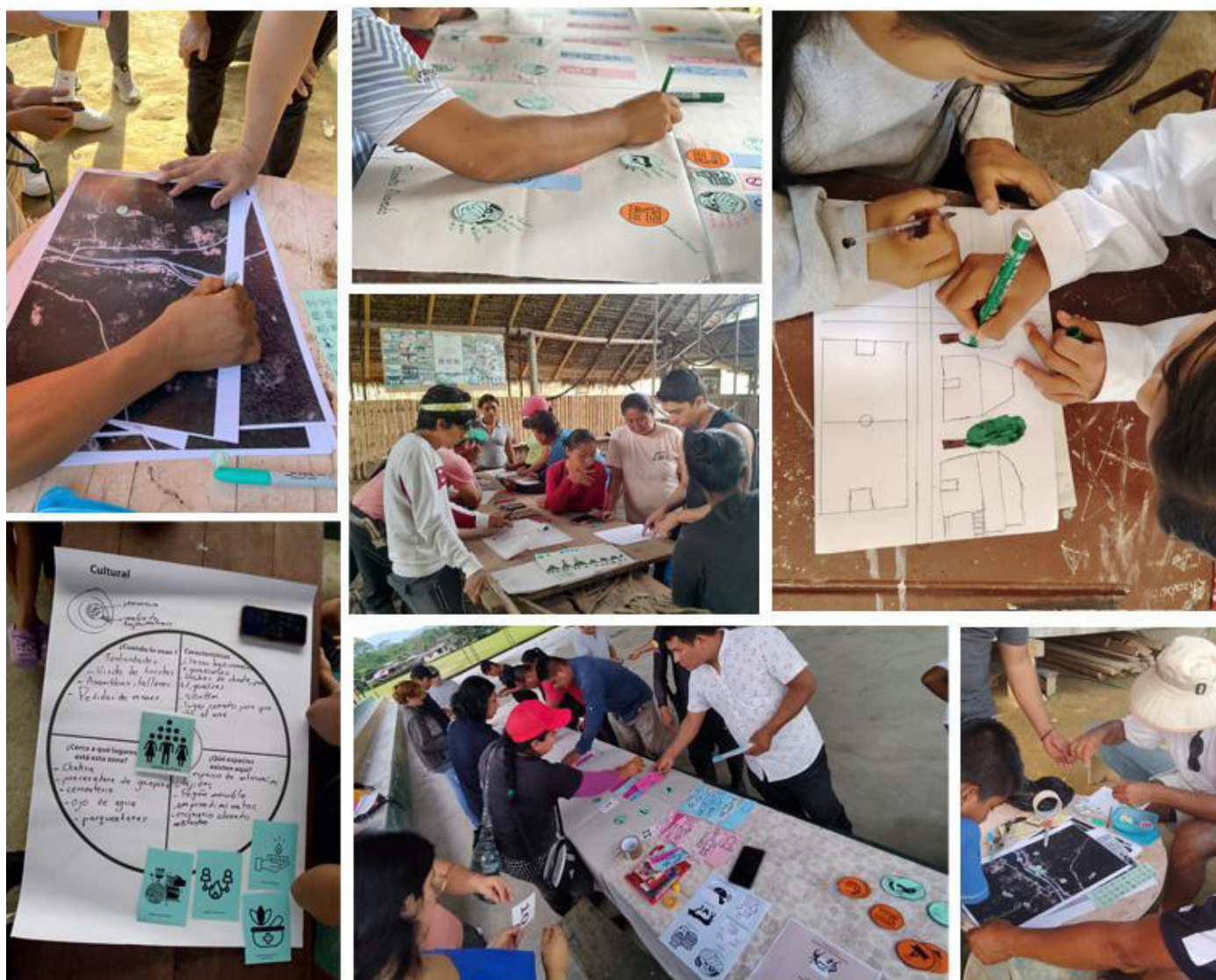
Figura 3. Desarrollo de procesos participativos con diversas metodologías

Gracias a la experiencia previa del equipo en procesos territoriales amazónicos, se implementaron estrategias de comunicación intercultural mediante íconos, mapas y recursos gráficos, que facilitaron la interacción con comuneros cuya lengua principal es el kichwa. La inclusión de practicantes pertenecientes a los propios grupos locales fortaleció la mediación cultural y la confianza durante los talleres (ver Figura 3).