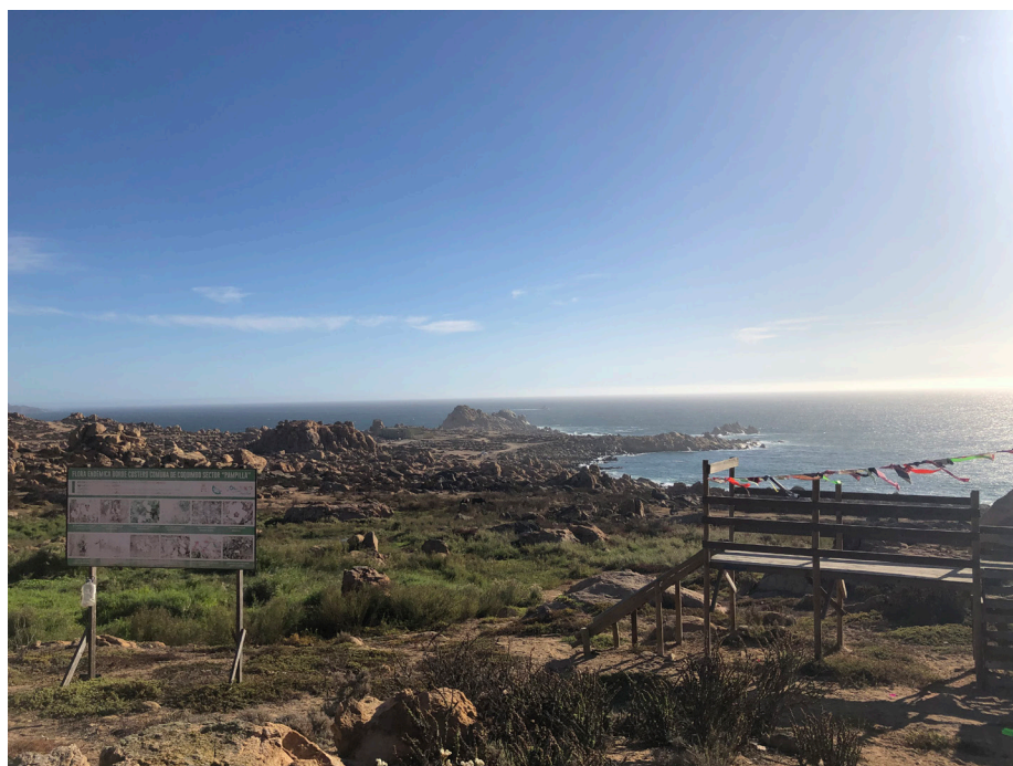
Figura 2. Vista de Las Peñas desde Avenida El Remanso, calle principal de Newen Kallfu