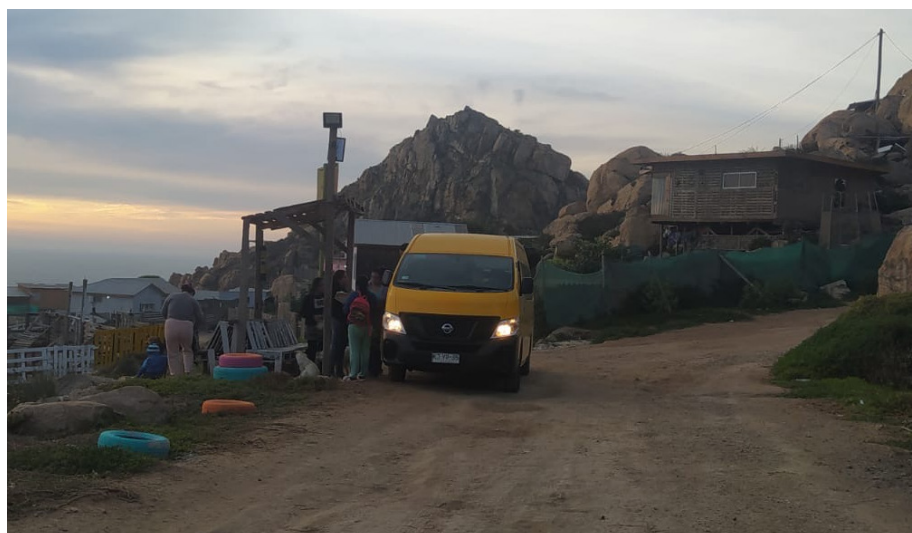
Figura 5. Primer día de uso del paradero autoconstruido