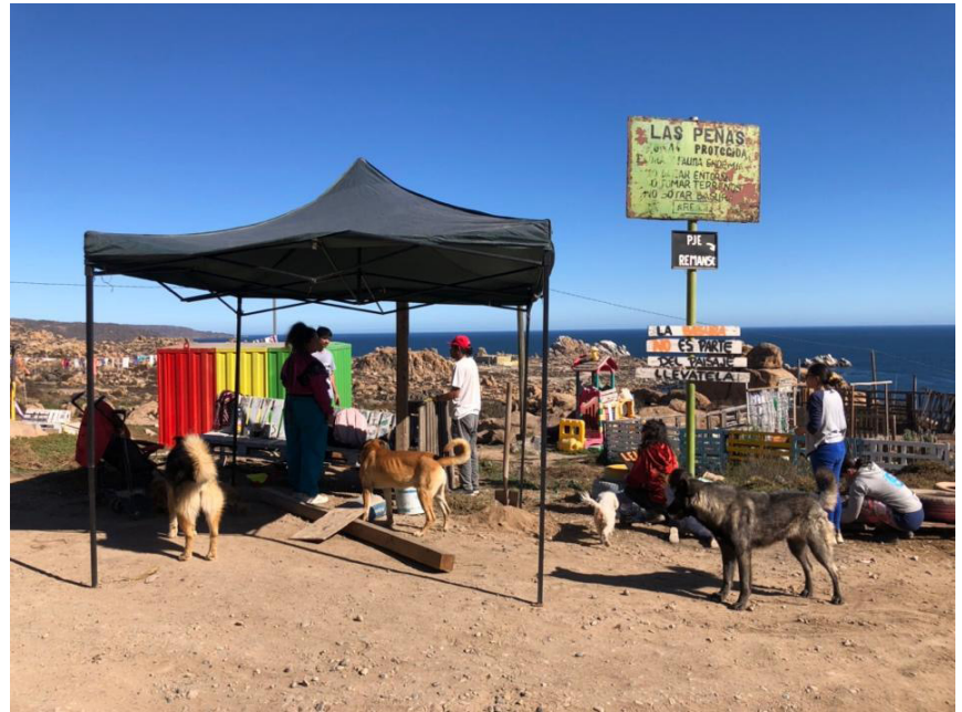
Figura 3. Autoconstrucción de paradero (jornada 1).