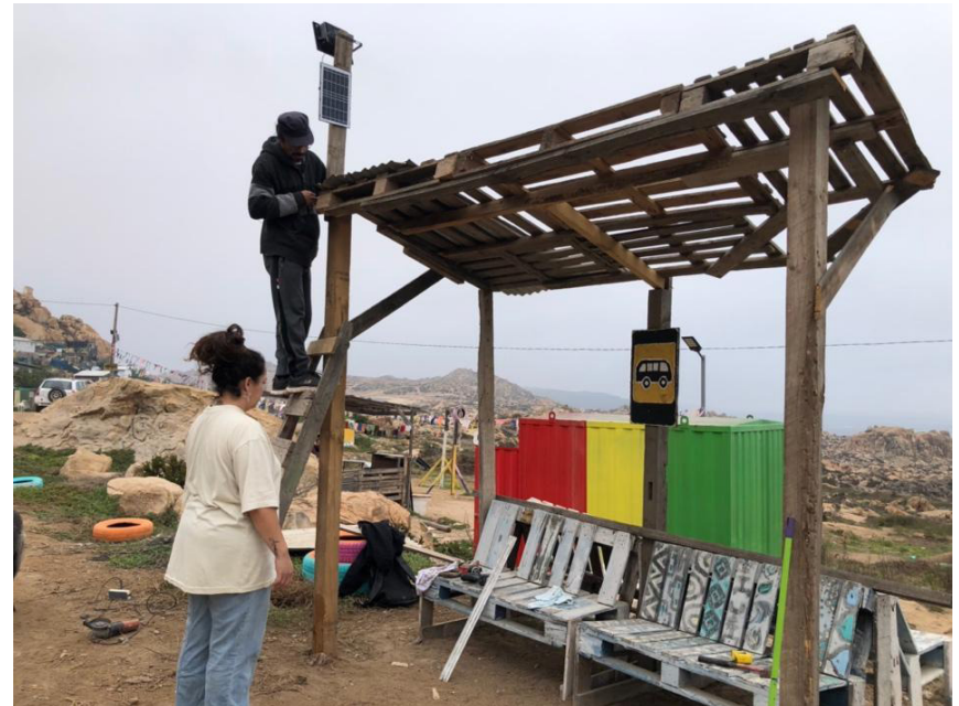
Figura 4. Autoconstrucción de paradero (jornada 2).