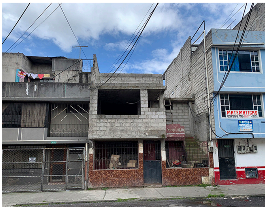
Figura 4. Contexto del caso de estudio Solanda