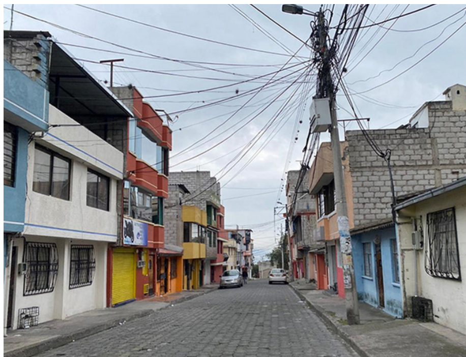
Figura 3. Contexto del caso de estudio Carapungo

[...] yo pienso que no es una urbanización hecha al azar, no. Porque Comité del Pueblo, eso sí es: le doy el terreno y allá, no había calles, no había nada. Aquí ya estaba hecho todo, esto era empedrado. Y el Concejo Provincial nos regaló los adoquines. Nosotros fuimos los que pusimos el dinero para que coloquen los adoquines y hagan los bordillos y las aceras también. Así fue como hicimos nosotros esto. (JF, comunicación personal, 2023)