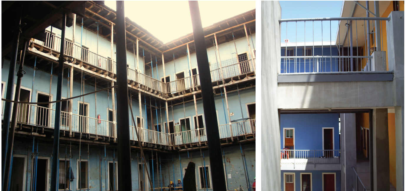
Cuadro No. 4. Fotografías comparativas de la Población Obrera (antes y después de la rehabilitación)