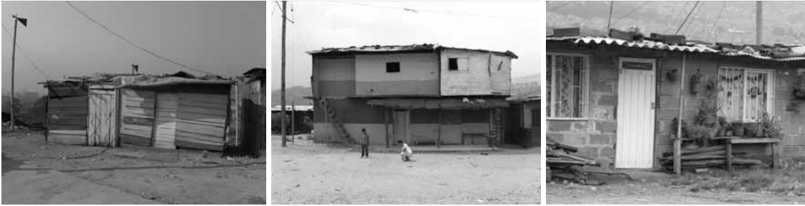
Figura 4. Fachadas en diferentes niveles de desarrollo progresivo