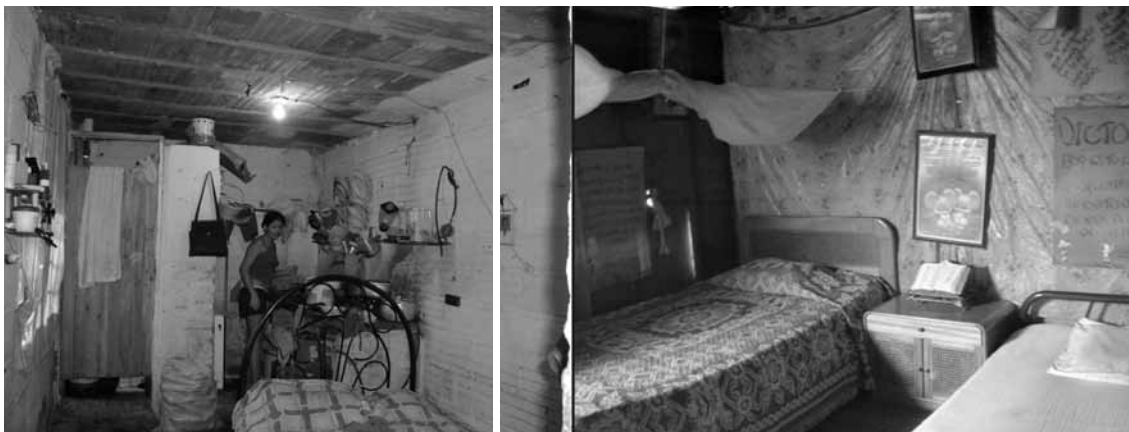
Figura 8. Habitáculos dentro de las viviendas.