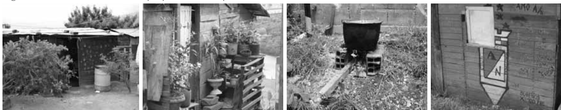
Figura 5. Diferentes formas de apropiación de la periferia de la vivienda.