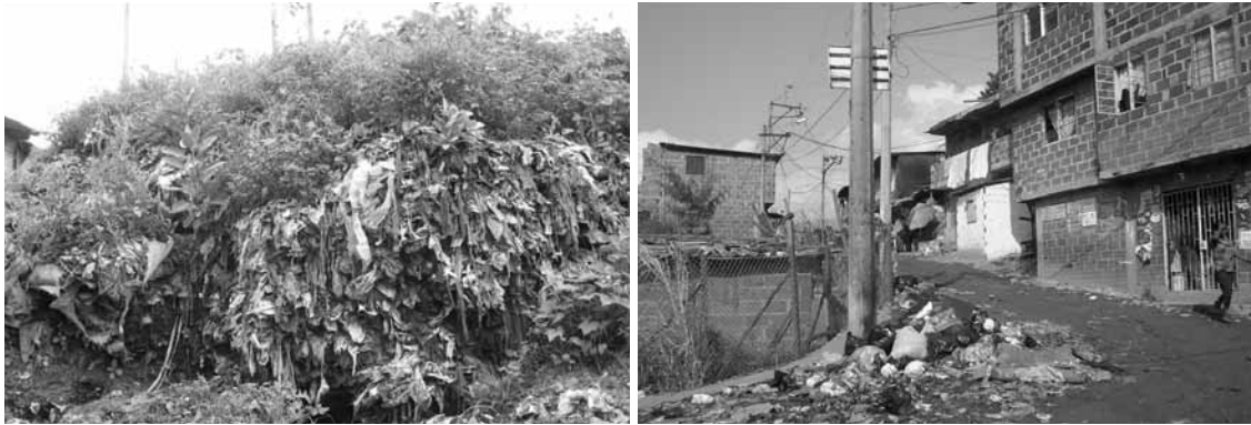
Figura 3. Trazado urbano y composición tectónica del sector El Morro.