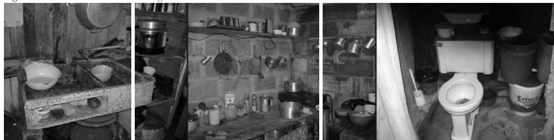
Figura 9. Características de la configuración de las zonas de servicios de la vivienda.