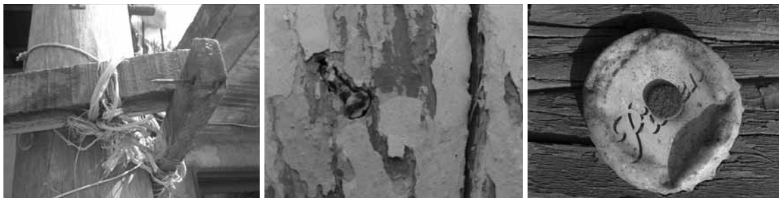
Figura 7. Repertorios técnicos representativos de las tácticas constructivas de la “malicia indígena” en la configuración del hábitat informal: sujeción de materiales con clavos y amarres, superposición y yuxtaposición de elementos estructurales irregulares, uso repetido y casi serial de algunos materiales de desecho.