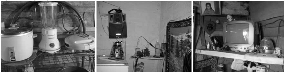
Figura 11. Rasgos representativos de la acomodación de diferentes electrodomésticos en el entorno de la vivienda.