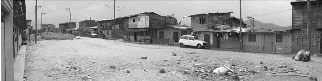
Figura 1. Paisaje doméstico de la cima del sector El Morro del barrio Moravia 1 .