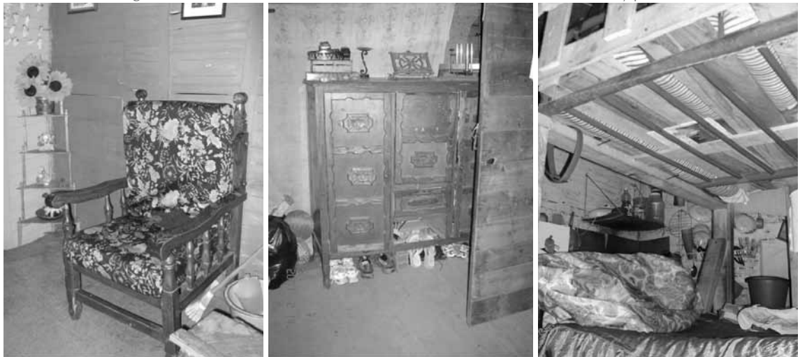
Figura 10. Características de los sistemas de amoblamiento de las áreas sociales y privadas.