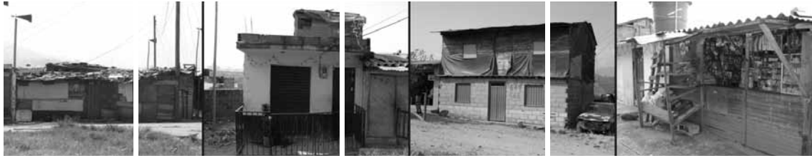
Figura 6. Diferentes etapas constructivas de la vivienda informal.