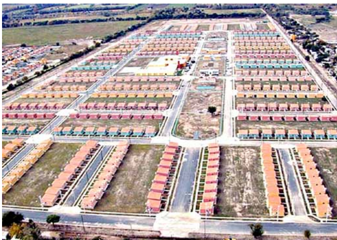
Fotografía 1. Imagen aérea de una de las ciudades-barrios.

Las viviendas individuales fueron construidas en el denominado "sistema constructivo tradicional", y se componen de cocina-comedor, dos dormitorios y núcleo sanitario. Cuentan