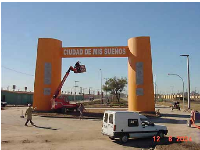
Fotografía 2. Arco característico en la entrada de las ciudades-barrios.

La toponimia, al construirse/constituirse sobre la analogía metafórica de “ciudades”, sostiene la voluntad de diferenciar las clases sociales en el espacio urbano. Por esto se construyeron formas espaciales (el arco de entrada y la estética característica) que generan un paisaje que comunica un discurso de armonía ilusoria entre sus habitantes y el medio, que intenta regularizar y poner orden en las relaciones sociales. En términos de Ana Levstein, “el arquitecto de ‘Ciudad de Mis Sueños’ es un pequeño dios, omnipotente, distante, inasequible, que se protege del dolor ante la pobreza, trazando una frontera rígida entre ‘nosotros’ y ‘ellos’” (Levstein, 2009: 62).