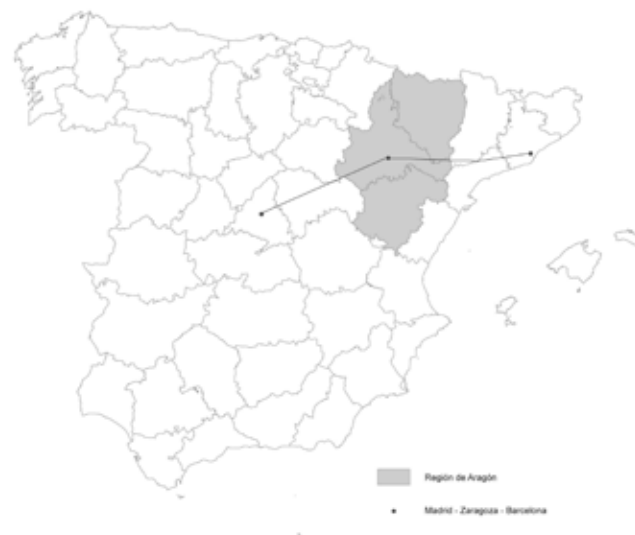
Figura No. 1. Esquema de localización de la región de Aragón.

Zaragoza es la capital de la comunidad autónoma de Aragón que cuenta con una extensión de 47.720 km 2 y 1.349.467 habitantes (Instituto Aragonés de Estadística, s.f.). Es una de las ciudades de mayor tamaño poblacional de la península Ibérica y ocupa una posición estratégica con respecto a su emplazamiento dentro de la geografía española: está localizada en el punto central del corredor del río Ebro, en el eje que comunica a Barcelona con Madrid (véase la Figura No. 1). Tras un crecimiento contenido hasta finales del siglo XX, la ciudad ha experimentado un crecimiento desmedido –tiene en la actualidad una población aproximada de 700.000 habitantes– propio de un área metropolitana caracterizada por el uso logístico e industrial del suelo en su entorno más inmediato, de forma que sus bordes urbanos se han transformado radicalmente. De manera simultánea al incremento de la población y a la formación del área metropolitana de Zaragoza, se ha dado una dinámica generalizada de decrecimiento poblacional –crecimiento negativo– en gran cantidad de pequeños núcleos de población que, junto con Zaragoza, conforman la realidad del sistema urbano de la región de Aragón (véase la Figura No. 2).