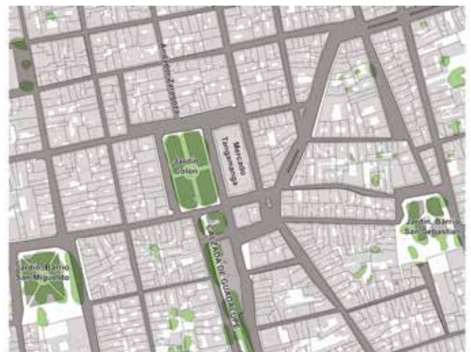
Ilustración 4. Estructura urbana