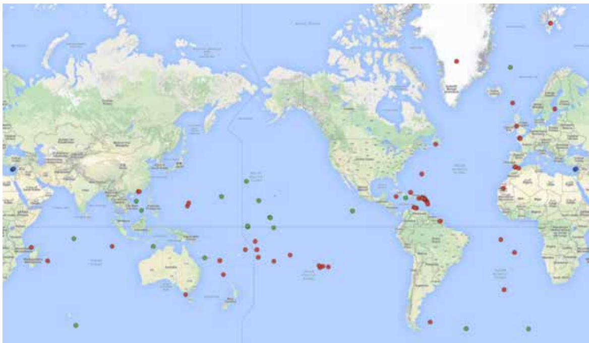
Figura 1. Mapa de los 72 territorios dependientes en el mundo