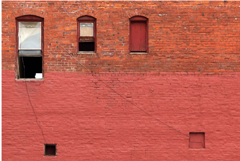
Imagen 1: Street Moment | Family?