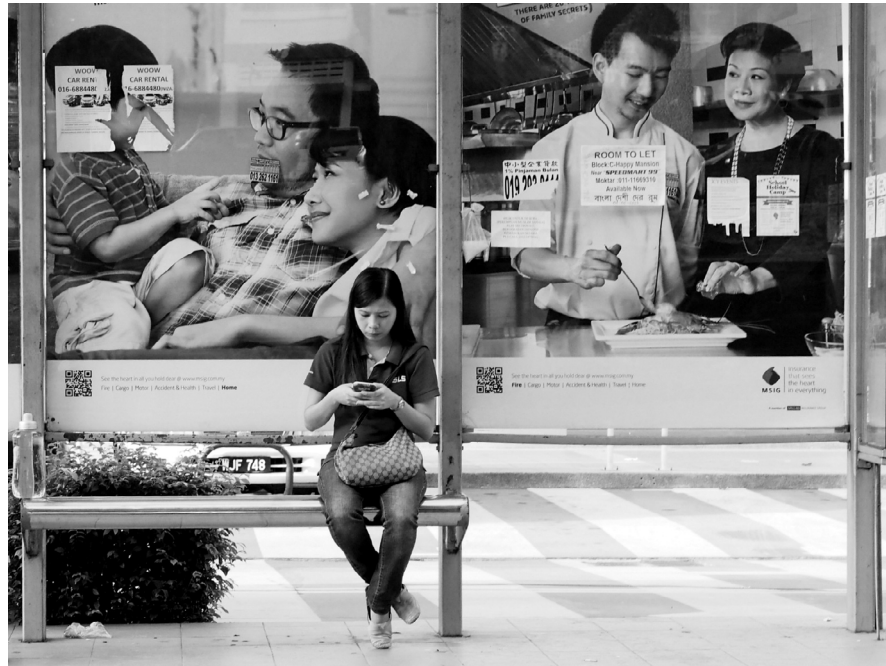
Imagen 2: The Executive Suite