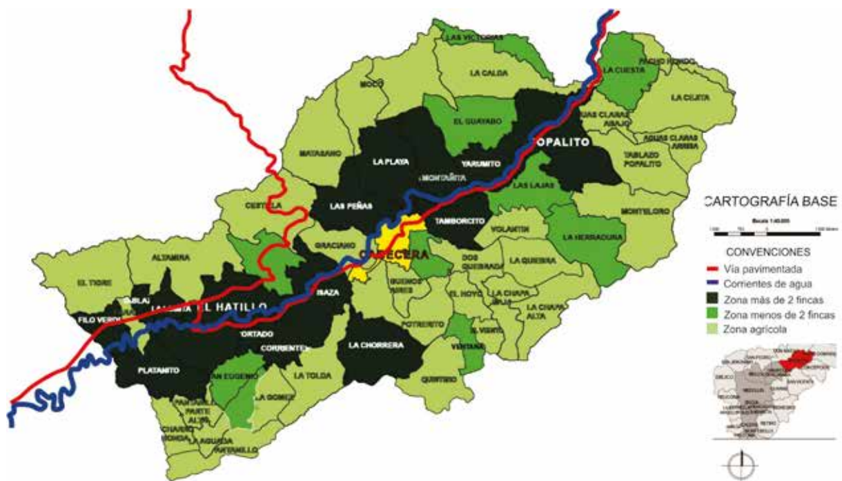
Figura 2. Ubicación de las fincas de recreo y de las principales veredas con producción agrícola