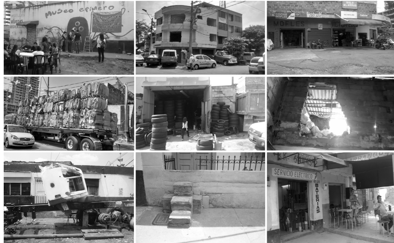
Figura 2. Territorialidades en el barrio El Naranjal

Sin embargo, la implementación del Plan Parcial ha convertido al barrio El Naranjal en un territorio en permanente negociación. Desde comienzo de la década de 1990 el sector había tenido