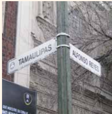
Imagen 1. Nombres característicos de las calles en Ciudad de México

Dicho de otro modo, el presente artículo trata sobre las características y usos que les dan a los espacios quienes crean negocios en La Condesa a partir del tipo de apropiaciones y resignificaciones que hacen los usuarios, los actores sociales que habitan allí o que la transitan, configurando posibilidades, estilos o concepciones que devienen lugares, es decir, espacios resignificados por los procesos de consumo tanto por aquellos que ofertan como por los que consumen lo que allí se produce. Tales conceptos permiten identificar la forma como se nombra, se categoriza, se visibiliza y se delimita un escenario local frente al resto de la metrópoli que le cobija.