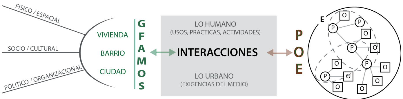
Imagen 2. Propuesta de integración escalar de las interacciones personas-objetos-entorno

Ello hace pertinente construir alternativas de análisis como la expuesta aquí, de manera que se avance en el conocimiento crítico sobre la ciudad a través de nuevas formas de aproximarse a la distribución y a las dinámicas sociales, culturales y económicas existentes en un territorio determinado, que es habitado de manera dinámica y que busca, más allá de levantar una representación visual del espacio estudiado o de un plano descriptivo de una planta urbana, complementarse con un análisis perceptivo que refleje la experiencia de sus habitantes.