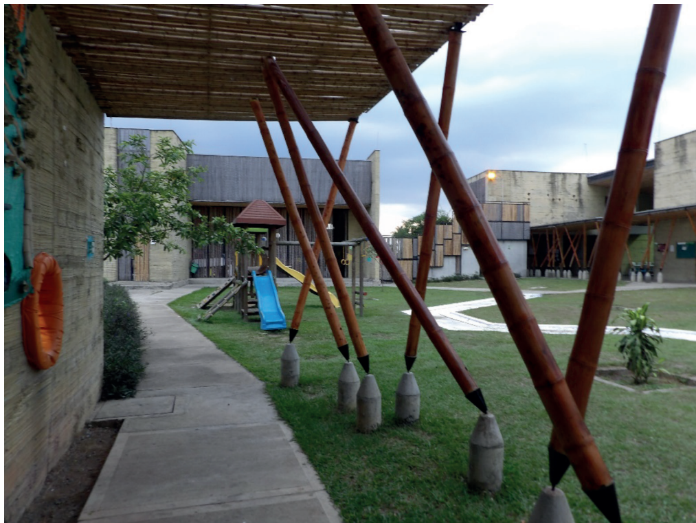
Figura 1. CDI El Guadual (Villa Rica, Cauca)

Inicialmente se adelantó en plazas de mercado y luego en colegios de primaria y secundaria a partir de herramientas sencillas como el dibujo. De modo paulatino, los niños y las niñas comenzaron a realizar ejercicios de dibujo mural. Dicha actividad transformó completamente la visión de los universitarios con respecto al diseño