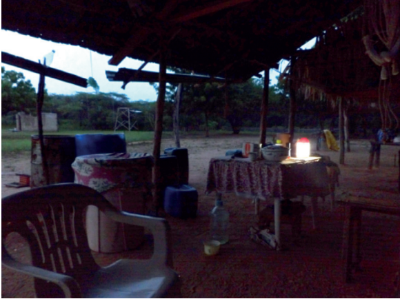
Figura 5. Ranchería Makú, cerca de Cuatro Vías (La Guajira)