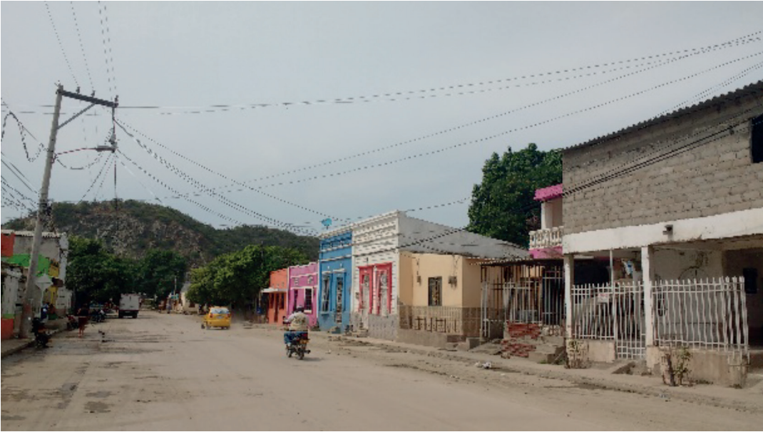
Figura 2. Barrio Pescaíto (Santa Marta, Magdalena)