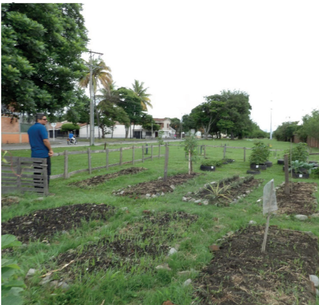
Figura 3. Huerta urbana pública de Palmira (Valle del Cauca)

Hoy, la huerta se sostiene con los recursos y la mano de obra de los vecinos, es totalmente pública (no tiene cerramientos ni aislamientos) y cualquier persona del barrio puede aprovechar lo que se produce allí.