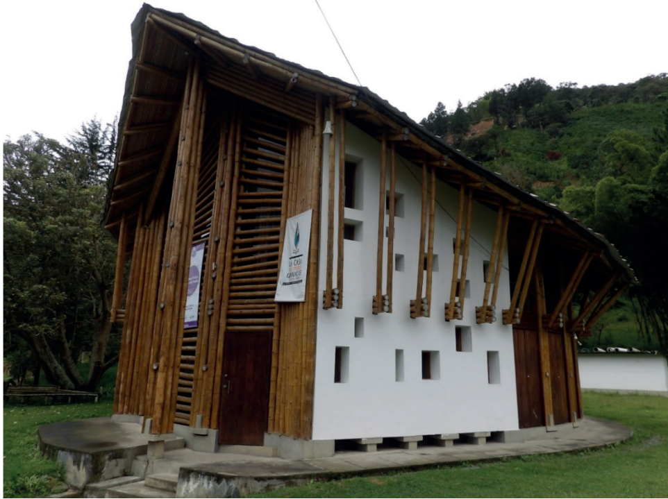
Figura 4. Biblioteca Pública La Casa del Pueblo (Guanacas, Cauca)