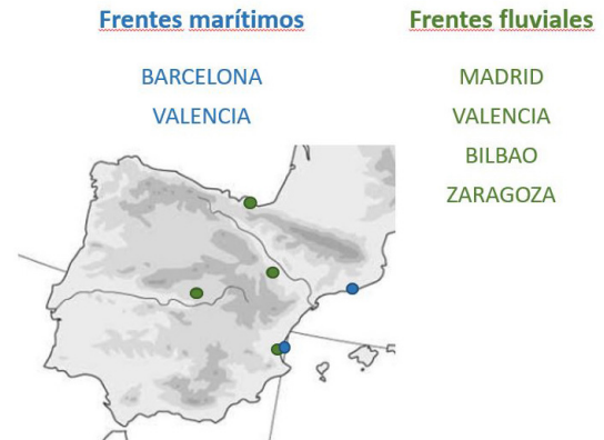
Figura 1. Selección de frentes marítimos y fluviales de las ciudades españolas