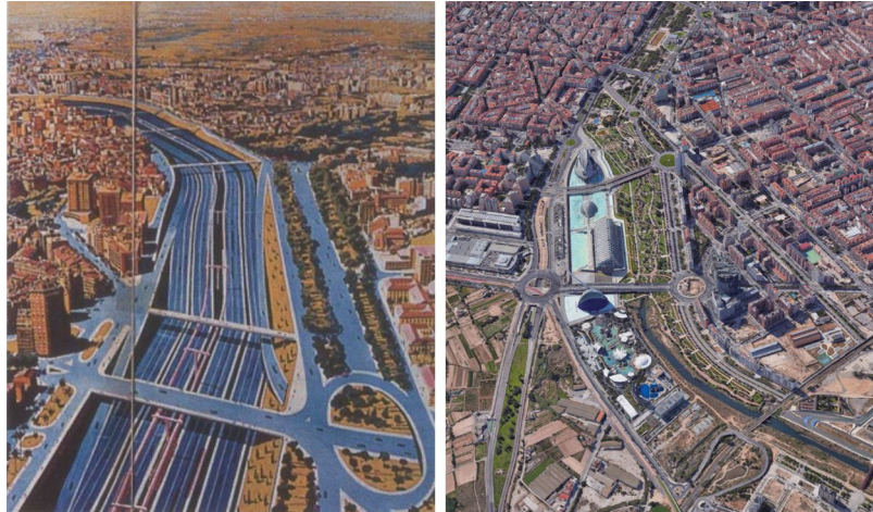
Figura 4. Propuesta de transformación del cauce del río Turia de 1967 y vista aérea actual