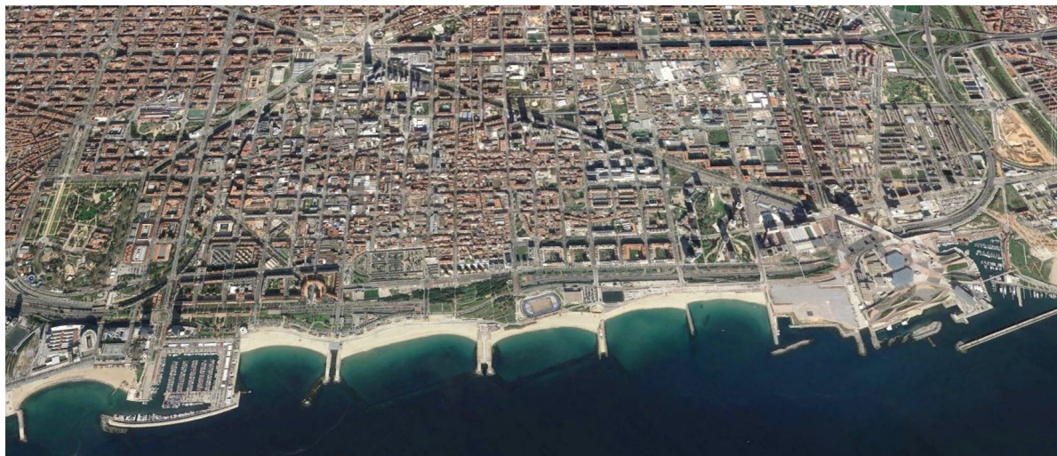
Figura 2. Frente litoral norte de Barcelona