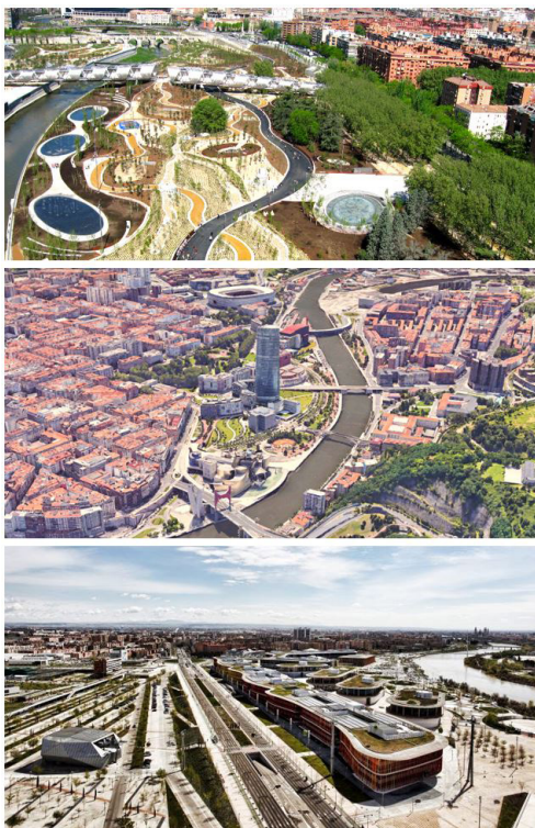
Figura 3. Imágenes de las transformaciones urbanas en los frentes fluviales de Madrid, Bilbao y Zaragoza

Nota: Madrid (imagen superior), Bilbao (imagen intermedia) y Zaragoza (imagen inferior).