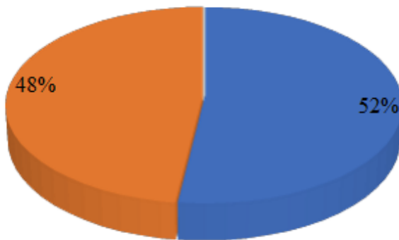
Graphique 2. Moyens de communication dans la ville de Dakar

La méthodologie adoptée dans la rédaction de cet article consiste à une enquête qualitative et quantitative effectuée auprès de la population de la ville de Dakar. L'enquête quantitative est faite au mois de mars 2018 auprès d'un échantillon de 500 individus pour apprécier le niveau d'utilisation des réseaux sociaux d'une part et d'autre part le recours au commerce via ces réseaux. Tandis que l'enquête qualitative concerne des commerçants contactés par le biais des réseaux sociaux ou qui sont retrouvés dans des marchés pour apprécier leurs opinions sur la vente via les réseaux sociaux. Cette enquête est effectuée à la même période.