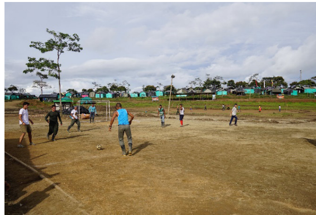
Imagen 3. Introducción de nuevos espacios convivenciales en los programas Construyendo Soluciones Sostenibles (Mesetas, Colombia) y Mejoramiento de Barrios (San Salvador, El Salvador)

Fotografías de Alfonso Pérez García-Burgos y Rafael Córdoba Hernández, 2018.