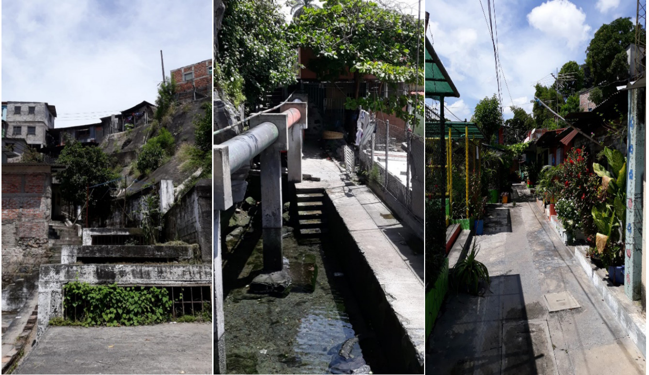
Imagen 2. Mejora ambiental del espacio público e introducción de redes de saneamiento en el barrio de Los Manantiales en San Salvador (El Salvador)

Fotografías de Alfonso Pérez García-Burgos y Rafael Córdoba Hernández, 2018.