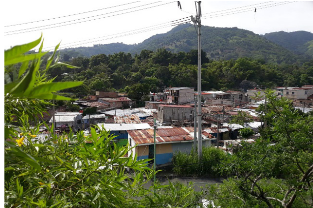
Imagen 1. Configuración de asentamientos informales en Istmina (Colombia) y San Salvador (El Salvador) Fotografías de Alfonso Pérez García-Burgos y Rafael Córdoba Hernández, 2018.

zamientos, una accesibilidad deficiente a las infraestructuras urbanas e importantes dificultades para acceder a empleo y a los servicios de transporte (Pérez García-Burgos y Córdoba Hernández, 2019).