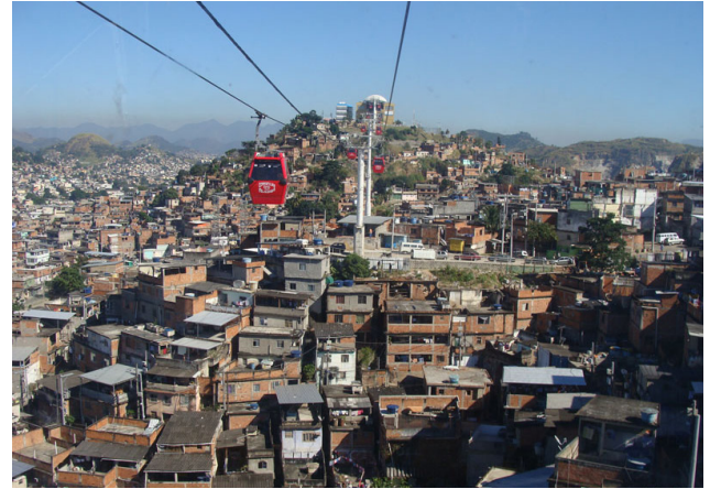
Figura 1. Vista del Complejo do Alemão desde una de las cabinas del teleférico. Al fondo se observa la estación Palmeiras, la última del recorrido

El momento de mayor ocupación del Complexo do Alemão ocurrió en la década de 1950, facilitado por la construcción de la línea de ferrocarril Leopoldina, además de la apertura de la avenida Brasil a mediados de la década de 1940, lo que estimuló rápidamente el crecimiento de la zona norte de Río de Janeiro. Posteriormente, en la década de 1990, comienzan las primeras manifestaciones de violencia asociada al narcotráfico, en una escalada que se extiende hasta la década de 2000. En noviembre de 2010, después de tres días de enfrentamientos armados con las fuerzas especiales de la policía, son expulsadas las principales bandas de narcotraficantes. En abril de 2012 se instalan las dos primeras Unidades de la Policía Pacificadora (UPPs) [3] definitivas, de un total de ocho planificadas para el área.