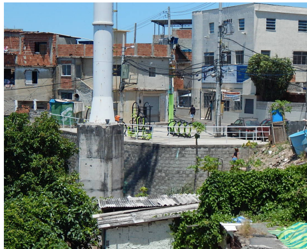
Figura 4. Pilar 20. Situación en 2016. Equipamientos de gimnasia instalados en la plataforma superior