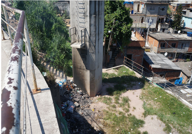
Figura 3. Espacio residual del pilar 20. A la izquierda, en 2013, el terreno baldío con acumulación y quema de basura. En 2014, a la derecha, el mismo terreno con una casa en construcción