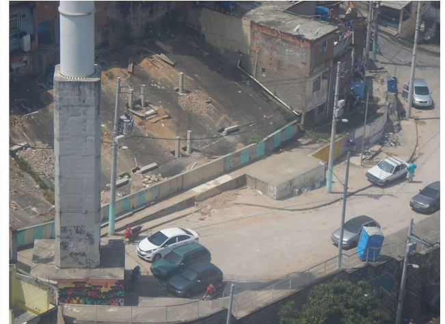
Figura 5. Pilar 23 y espacio residual visto desde el teleférico. A la izquierda, la situación en 2014 y 2015. A derecha, la situación en 2016 y 2017