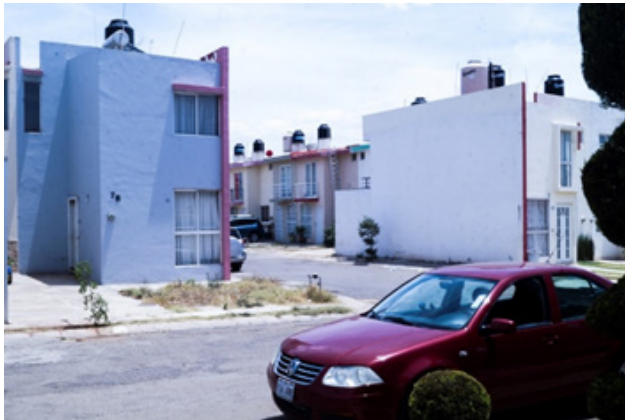
Figura 3. Residencias en el fraccionamiento Jardines de San Rafael.