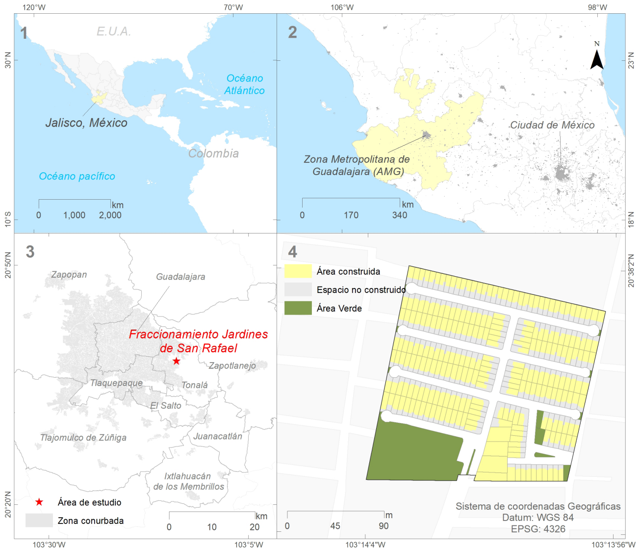
Figura 2. Localización del área de estudio.