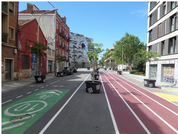
Figura 1. Uno de los ámbitos de intervención de la Supermanzana del Poblenou en el período pre-pandémico

Barcelona padece desde hace tiempo de niveles de contaminación atmosférica y acústica elevados que superan persistentemente los límites de la OMS, lo que afecta la salud del ser humano y produce el au-