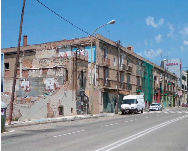
Figura 3. Ruinas de La Escocesa