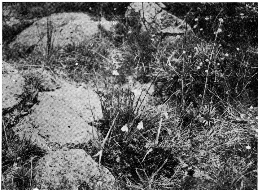
Fig. 2.— Pinguicula diversifolia Cuatr. en el páramo de Guantiva.