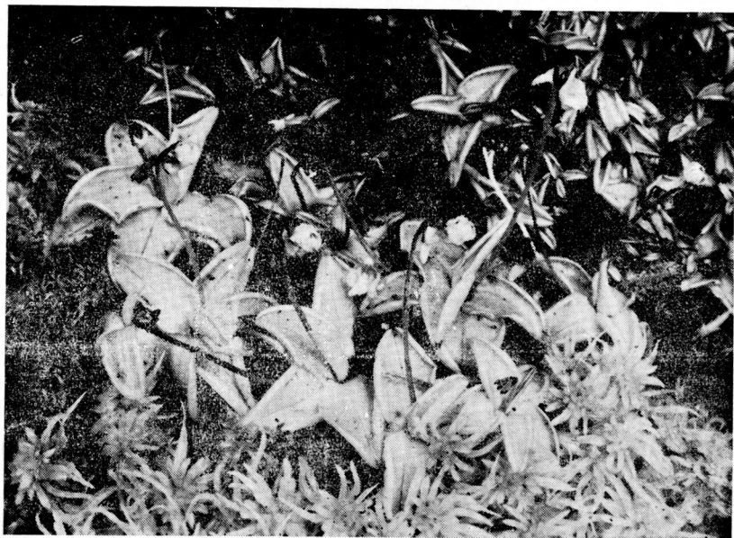
Fig. 3.— Pinguicula huilensis Cuatr. en la Quebrada del Duende.