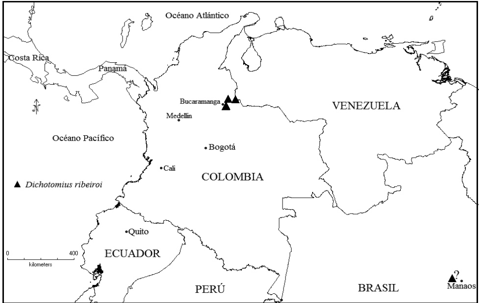
Figura 2. Mapa de distribución de Dichotomius ribeiroi .