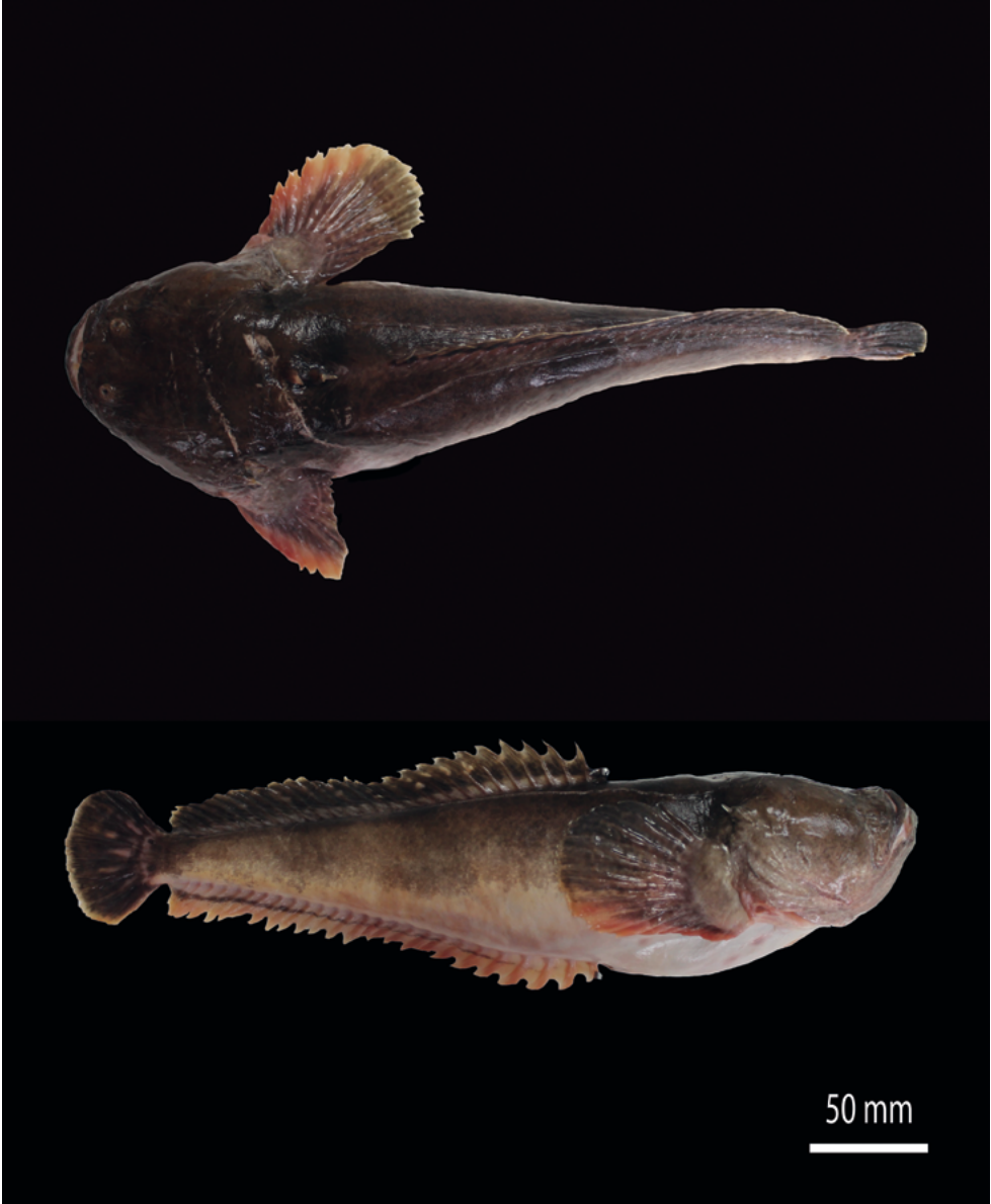
Figura 2. Fotografía de Daector gerringi (CIRUV-017021) colectado en la desembocadura del río Dagua (03°51'28,3" N, 77°04'25,6" O), bahía de Buenaventura, Colombia.

proyecto, además se reconoce y agradece a Raúl Neira y Carlos Lucero, quienes fueron partícipes de la captura del espécimen y a la Universidad del Valle, por brindar los laboratorios en los cuales se realizaron las observaciones.