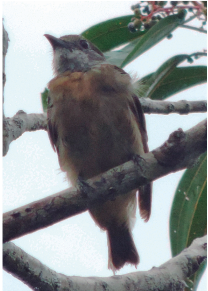
Figura 2. Registros fotográficos de una hembra de Heterocercus aurantiivertex en el Parque Nacional Natural La Paya, Leguizamó, Putumayo.

En la Amazonia occidental confluyen las distribuciones de las tres especies del género Heterocercus (Fig. 1): H. flavivertex al norte de Chiribiquete y extremo oriental de Colombia por la cuenca del río Negro casi hasta Santarem, H. linteatus (Strickland, 1850) en la Amazonia brasileña y extremo nororiental de Perú al sur del río Amazonas, y H. aurantiivertex al extremo occidental de Amazonia en Ecuador y norte de Perú (NatureServe e IUCN c2007). La distribución y preferencia de hábitat de H. aurantiivertex es similar a otra especie recientemente registrada al norte del río Putumayo, Thamnophilus praecox J. T. Zimmer, 1937, lo cual podría desestimar el rol del río Putumayo como una barrera biogeográfica a la altura del PNN La Paya. Sin embargo, Janni et al. (2018) reportaron en El Encanto, 300 km al suroriente del PNN La Paya, amplitudes de distribución hacia el sur de especies representantes del área de endemismo Imeri, las cuales no han sido reportadas al sur del río Putumayo (e.g. Pitman et al. 2016). Es decir que el rol del río Putumayo como una barrera