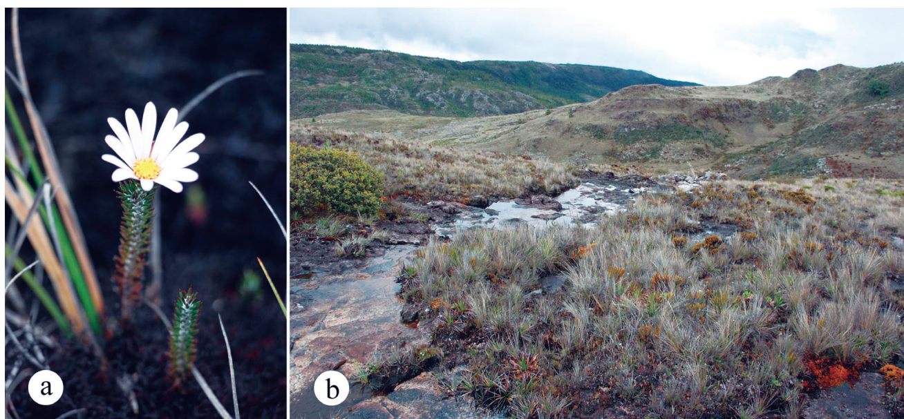
Figura 2. Xenophyllum acerosum en la Cordillera Cordoncillo, a. planta en flor, b. hábitat.

ECUADOR, Azuay : Cordillera Cordoncillo, a lo largo de la vía Babes (ca. 2 km al este de Urdaneta) hacia 28 de Mayo, en afloramientos rocosos y lugares pantanosos de páramo herbáceo con plantaciones de pinos perturbados por la quema, W 79°06'31", S 03°34'39", 3070 m, 10 nov 2018, Sklenář et al. 15820 (QCA, PRC); Loja : Cordillera Oriental, entre Oña y el río Yacuambi, cresta, 10,000–11,900 pies, 10–19 sept 1945, Prieto F. P-280 (F, G, GH, MO, NY, P, S, UC, US).