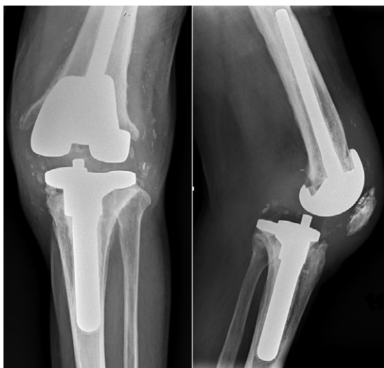
Figura 1. Radiografía simple anteroposterior (AP) y lateral de rodilla. Se evidencia patela baja y luxación posterior de prótesis de revisión.

Los exámenes de laboratorio de ingreso mostraron niveles normales de leucocitos (6 030mg/dL) y neutrófilos (2 640mg/dL), y proteína C reactiva (PCR) elevada (32mg/L). La radiografía simple de rodilla izquierda de ingreso mostró patela baja y luxación posterior de prótesis de revisión (Figura 1). Ante la sospecha de un nuevo episodio de infección periprotésica concomitante, se realizó toma de hemocultivos.