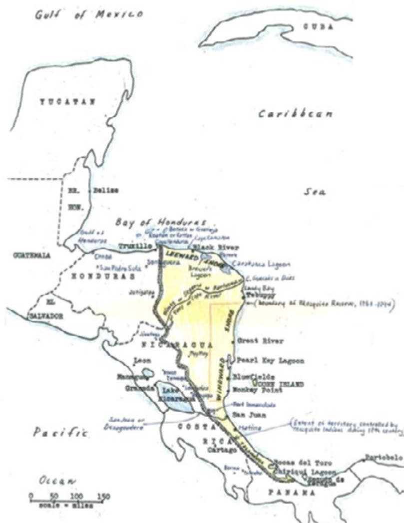
Figura 1. Mapa de Centroamérica y el territorio de La Mosquitia (ilustración propia)

Históricamente, teníamos acceso libre, pero hoy en día los gobiernos nos exigen pasaporte y otros requisitos. Quiero aclarar que muchas veces no nos interesa el pasaporte, porque aunque el río dividió dos pueblos o dos países, las fronteras fueron impuestas por los gobiernos sin consulta previa, libre e informada. Esto significa que en Nicaragua viven Miskitos que son de Honduras, y en Honduras viven Miskitos que son de Nicaragua.