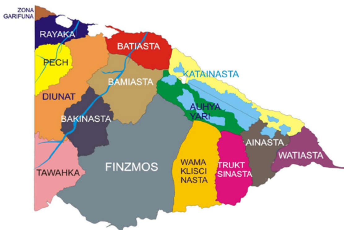
Figura 3. Consejos Territoriales de La Moskitia de Honduras (elaboración propia).

Como pueden ver (Figura 3), ahí aparecen los doce consejos territoriales, como Rayaka , Pech , Diunat , Batiasta , Bamiasta , Katainasta , Watiasta , que es frontera, y Ainasta , entre otros. Todos son territorios jurídicos. Este proceso comenzó en 1985 con el apoyo de una organización alemana a través de Sistemas de Información Geográfica (GIS). Contamos con la colaboración del señor Peter Herlihy, de la Universidad de Kansas City y otros amigos no hondureños.