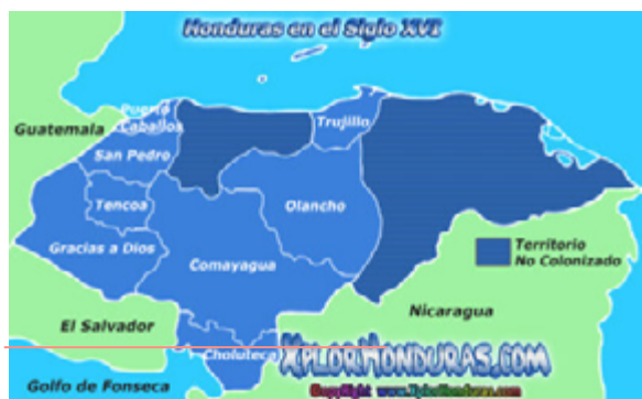
Figura 2. Mapa de Honduras en el Siglo XVI (Xplorhonduras, s.f)

Quiero mostrar también el mapa de Honduras de la época republicana (Figura 2), cuando el territorio de La Mosquitia era administrado por sus propias autoridades. La Mosquitia está en la parte sur, en la puntilla donde se encuentra Cabo Gracias a Dios. Al norte, se puede observar un departamento que dice Trujillo, y La Mosquitia también converge con el departamento de El Paraíso. Históricamente, La Mosquitia ha sido un territorio habitado por cuatro pueblos ancestrales que han vivido en el marco de su cosmovisión. Hemos reflexionado sobre cómo asegurar nuestro territorio en compañía de nuestros hermanos nicaragüenses.