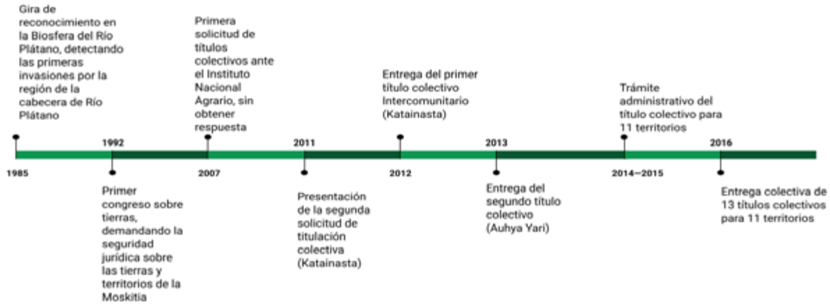
Figura 4. Línea de tiempo de la Titulación de las tierras Indígenas de La Moskitia de Honduras.

En 1992, durante el primer congreso de tierras, demandamos la seguridad jurídica, identificando las comunidades Indígenas de la Moskitia (Figura 5).