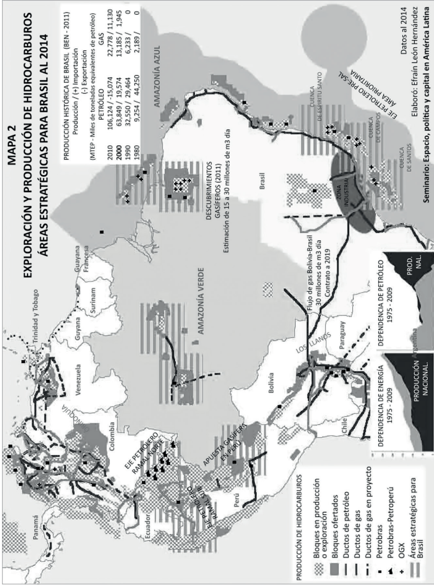
Mapa 2. Exploración y producción de hidrocarburos: áreas estratégicas para Brasil al 2014