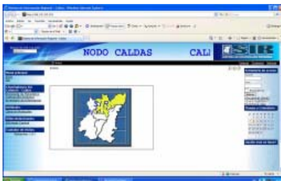
Página web Nodo Caldas del SIR

Palabras Clave: Tecnología de la Información y Comunicación (TIC), Sistema de Información Geográfica (SIG), Laboratorio, Metadatos, Nodo, Mapas, Cleringhouse.